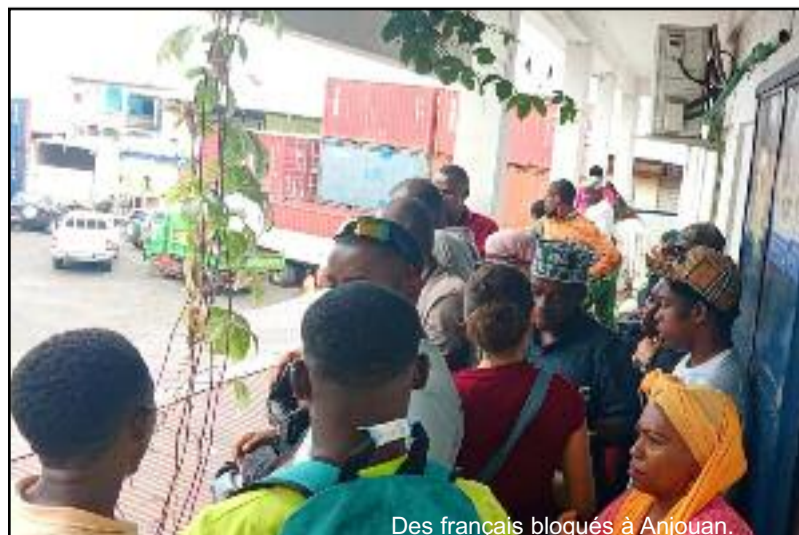
Des français bloqués à Anjouan.

sans espoir de rentrer à Mayotte. Cette dernière refuse de faire le moindre commentaire. Dans tout ça, quatre personnes ont laissé entendre qu'ils ont une correspondance et d'autres parlent de «