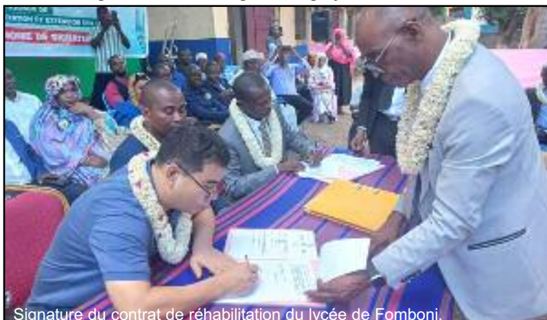
Signature du contrat de réhabilitation du lycée de Fomboni.

Pour être informé, je lis la Gazette chaque jour