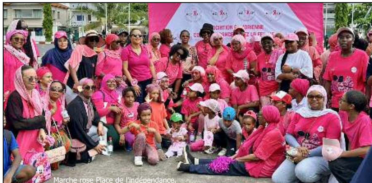
Marche rose Place de l'indépendance.