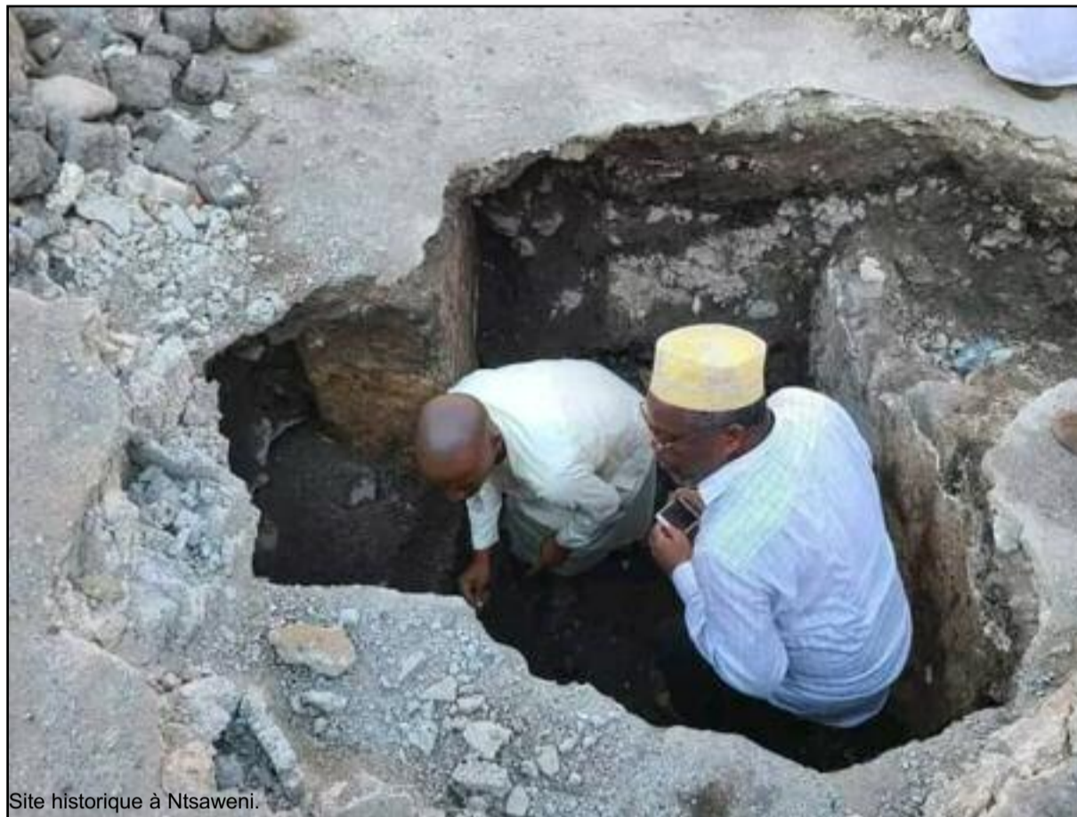
Site historique à Ntsaweni.