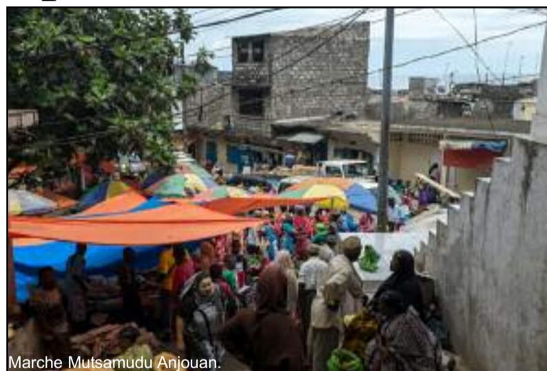
Marche Mutsamudu Anjouan.

En ce qui concerne les produits locaux, le tas de banane qu'on achetait à 2000 FC avoisine les 5000 FC. Le prix du manioc a aussi doublé et les revendeuses ont brusquement provoqué une pénurie artificielle. « Depuis ces dernières heures, une hausse considérable de certains prix est constatée dans les deux principaux marchés du chef-lieu