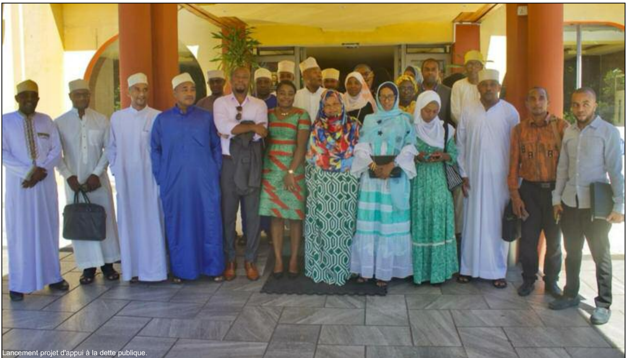
Lancement projet d'appui à la dette publique.