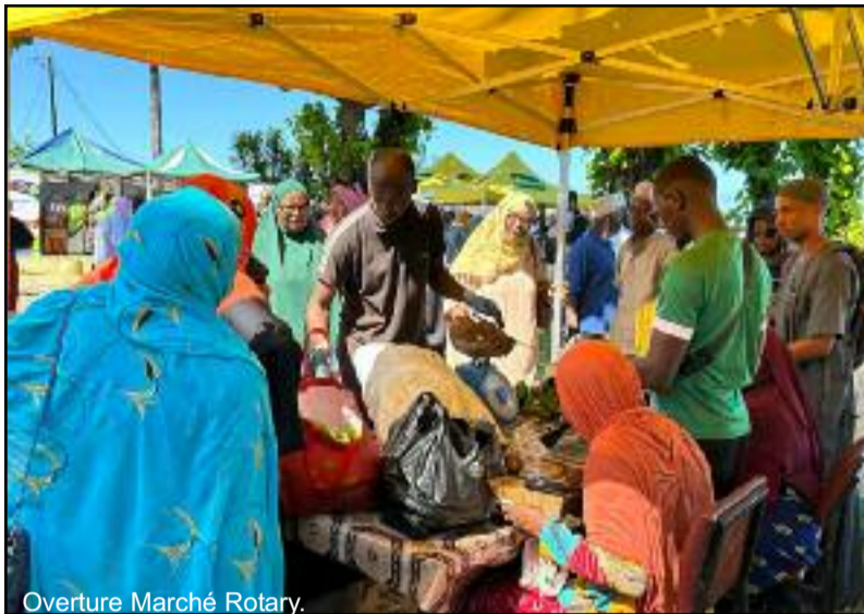
Overture Marché Rotary.

Comme tous les ans, les CRDE en étroite collaboration avec le ministère de l'agriculture se mettent à la disposition de la population en vue de faciliter la vente des produits locaux à coût réduit. Encore une fois, le Rotary club accueille le marché spécial ramadan.