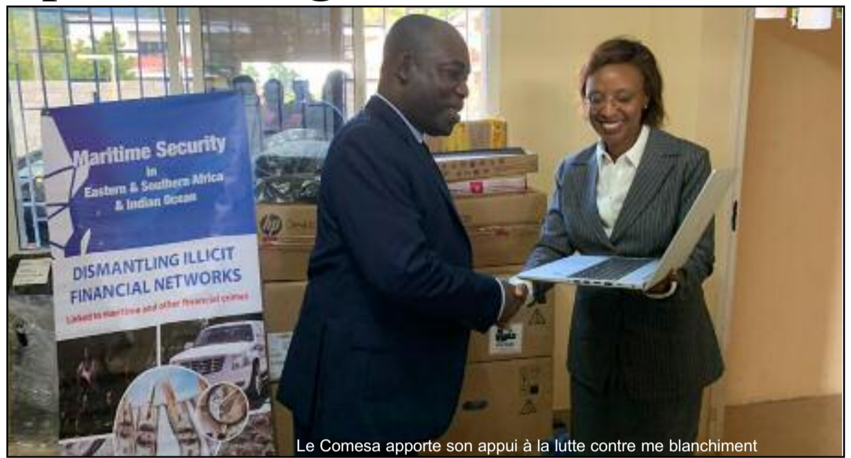
Le Comesa apporte son appui à la lutte contre le blanchiment

De ce fait, il montre qu'en plus des organismes internationaux à l'instar du GAFI, GIABA et autres, les cellules nationales de renseigne-