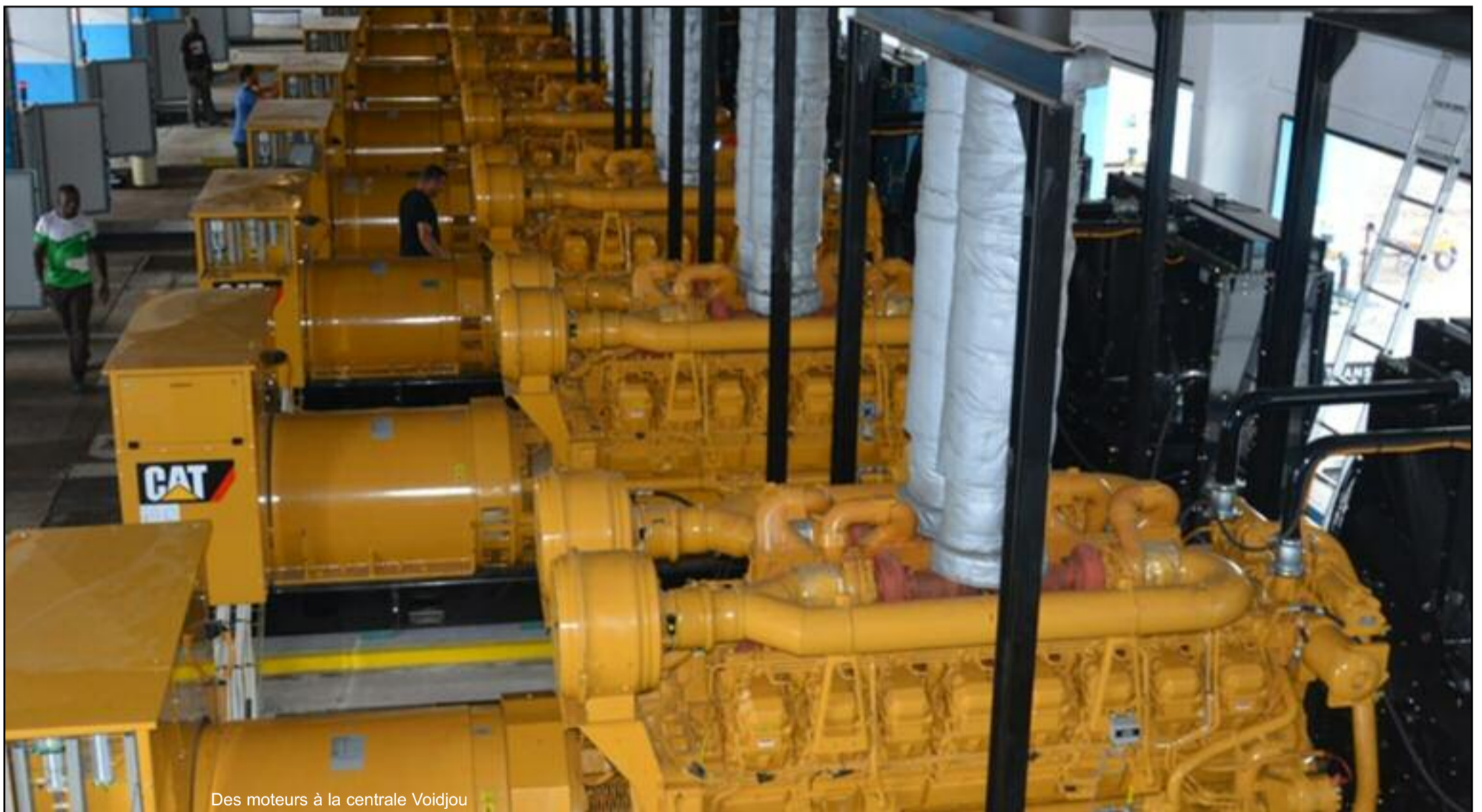
Des moteurs à la centrale Voidjou