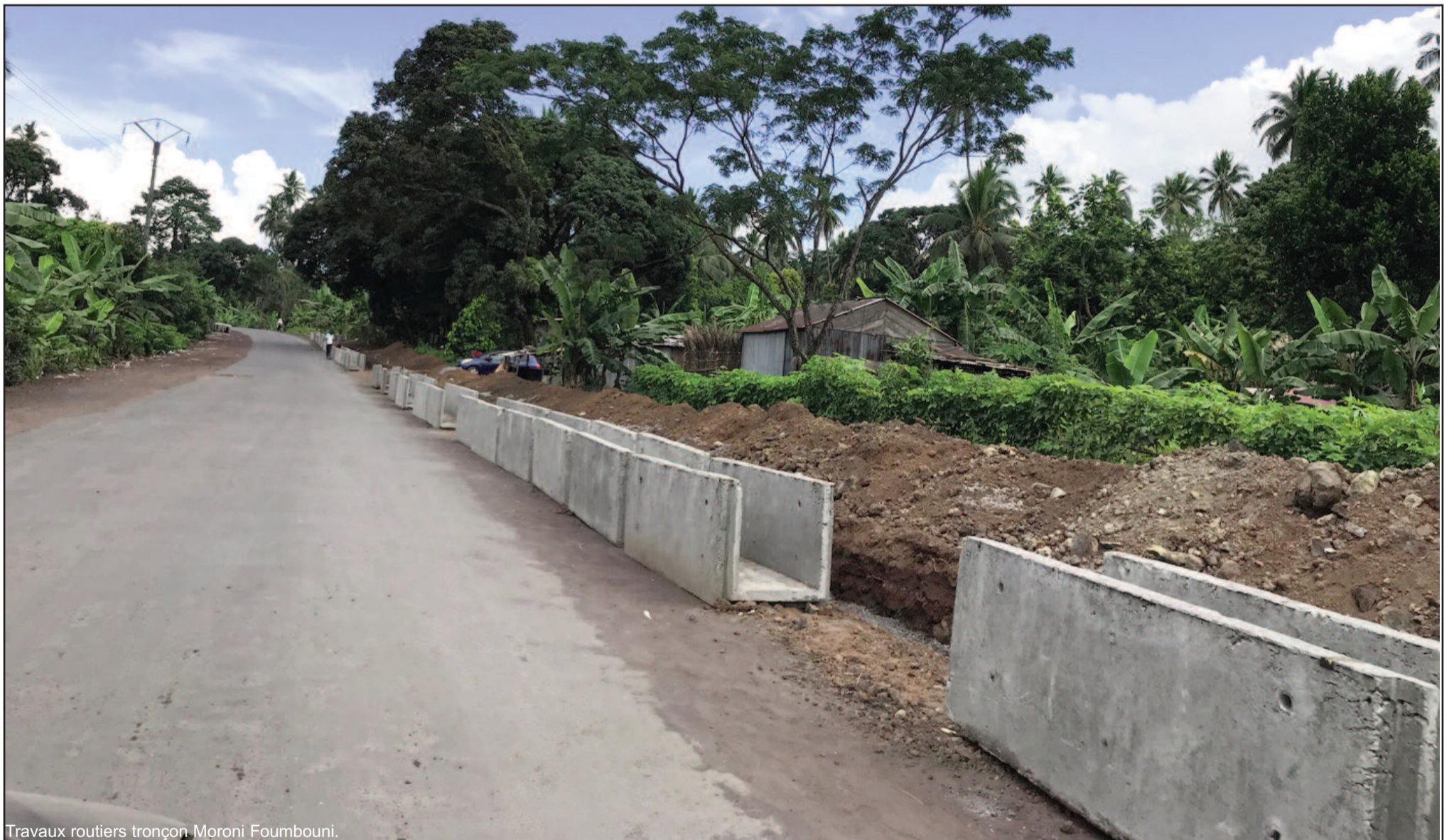
Travaux routiers tronçon Moroni Fombouni.

PRÉVENTION ET SÉCURITÉ ROUTIÈRE EN FIN D'ANNÉE