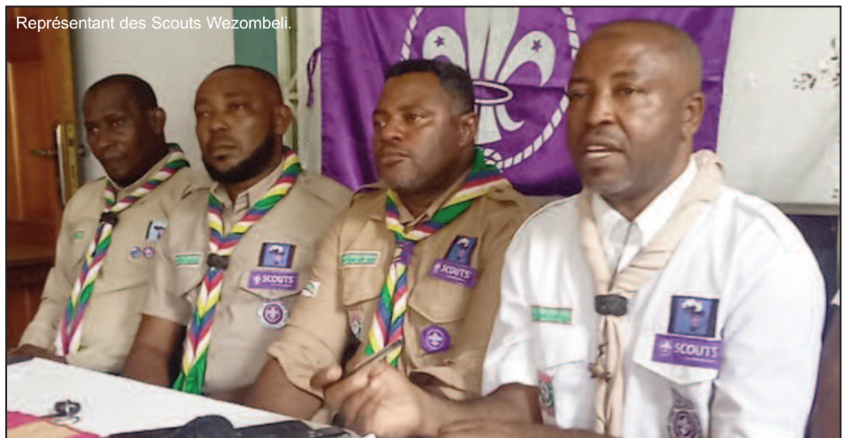
Représentant des Scouts Wezombeli.