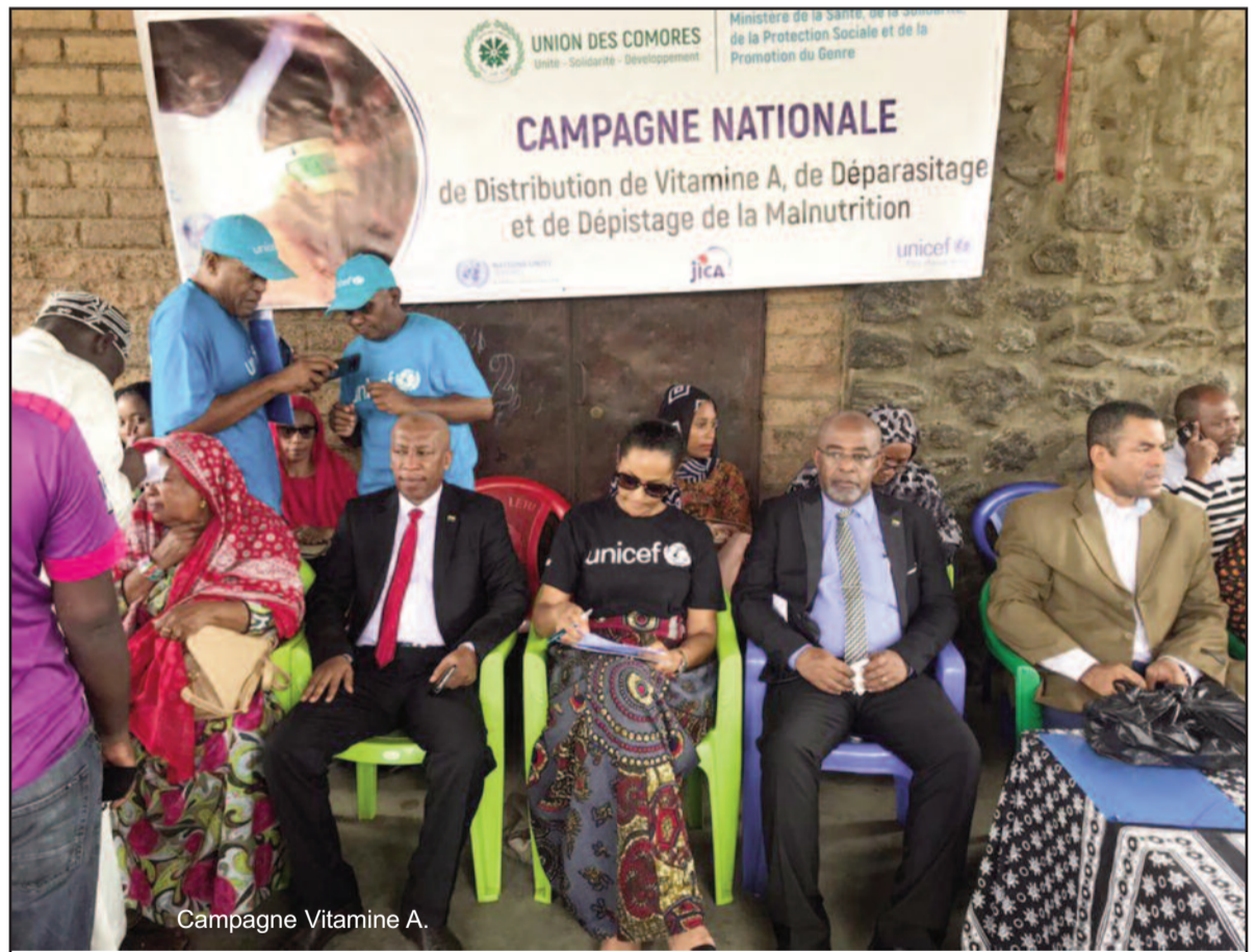
Campagne Vitamine A.