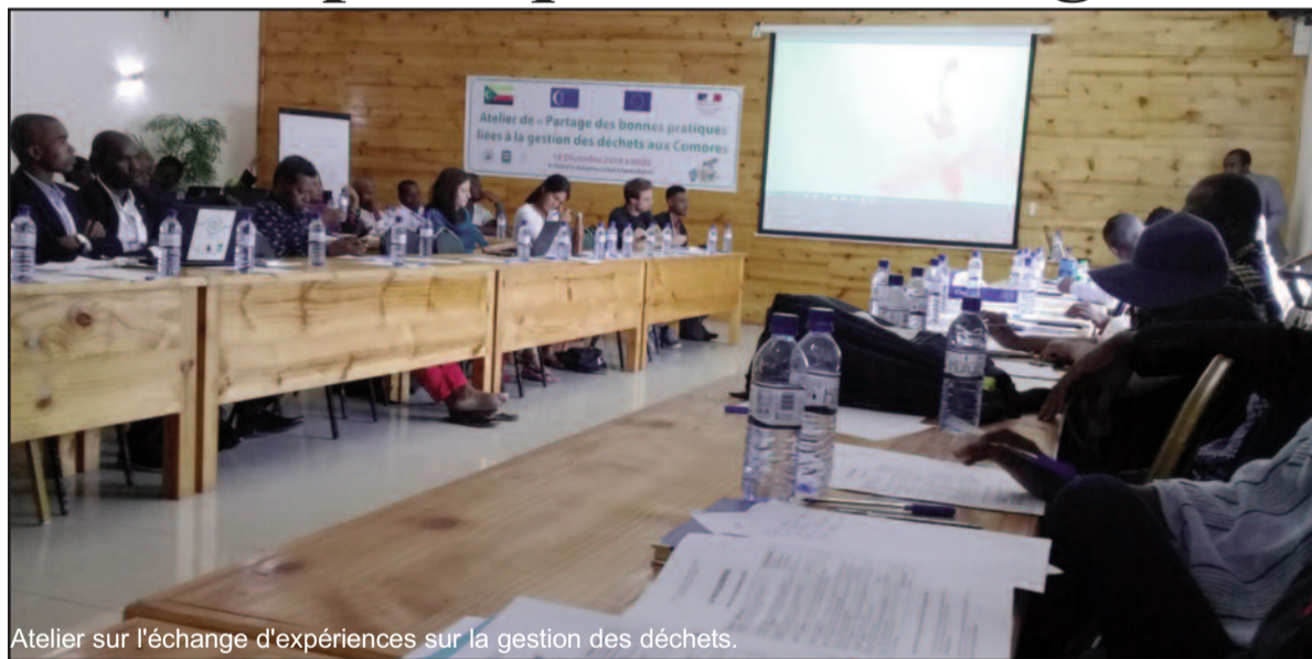
Atelier sur l'échange d'expériences sur la gestion des déchets.

senté son projet national de gestion durable des déchets et son centre de tri et de valorisation des déchets recyclables à Moroni. L'expérience de l'association a montré que la gestion des déchets nécessite de disposer d'outils tant techniques que de gestion pour avoir la maîtrise de l'ensemble du processus.