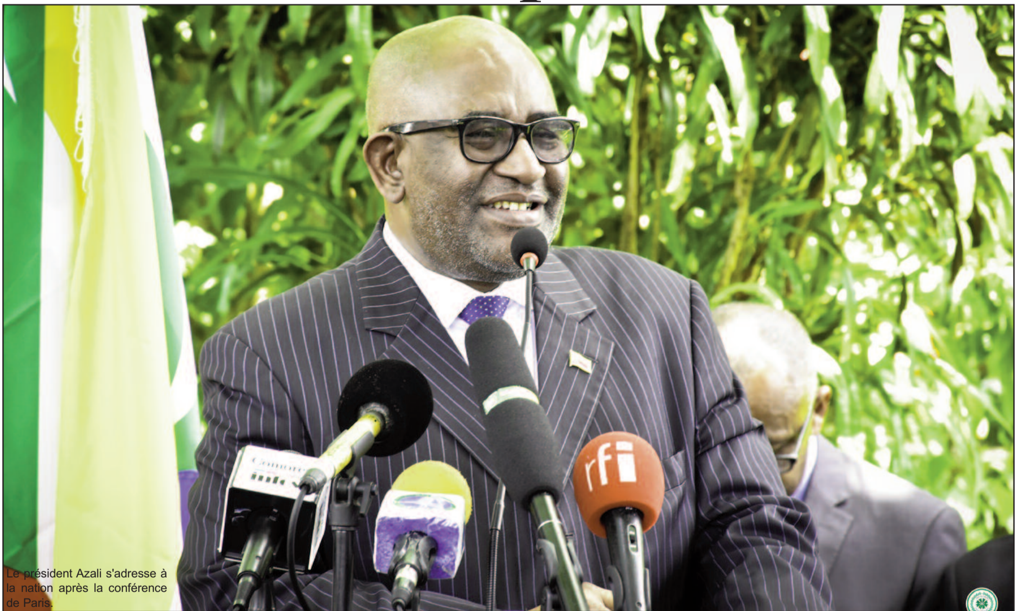
Le président Azali s'adresse à la nation après la conférence de Paris.