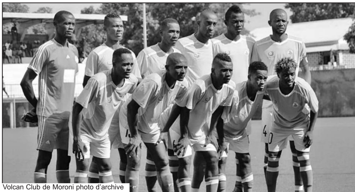
Volcan Club de Moroni photo d'archive

URUMQI -- Le nombre de touristes dans la région autonome ouïgoure du Xinjiang (nord-ouest de la Chine) a dépassé 200 millions de janvier à octobre, en hausse de 42,62% par rapport à la même période l'année dernière, ont annoncé les autorités locales. Les recettes touristiques des dix premiers mois ont atteint 341,73 milliards de yuans, en hausse de 43,39% sur un an, atteignant un niveau record, selon le département régional de la culture et du tourisme. Riche de ses cultures ethniques diverses et de ses paysages uniques, le Xinjiang s'est engagé à se transformer en destination populaire pour les touristes chinois et internationaux. Une série de mesures ont été prises, dont l'amélioration de la construction d'infrastructures, le traitement des problèmes de stationnement et la garantie de signaux de téléphonie mobile stables pour les touristes. "L'hiver approche, et le Xinjiang enrichira ses produits du tourisme hivernal et garantira la fluidité de la circulation pour attirer plus de touristes souhaitant découvrir les paysages hivernaux du Xinjiang", a déclaré Wu Feng, chef de l'Association des services de voyages du Xinjiang.