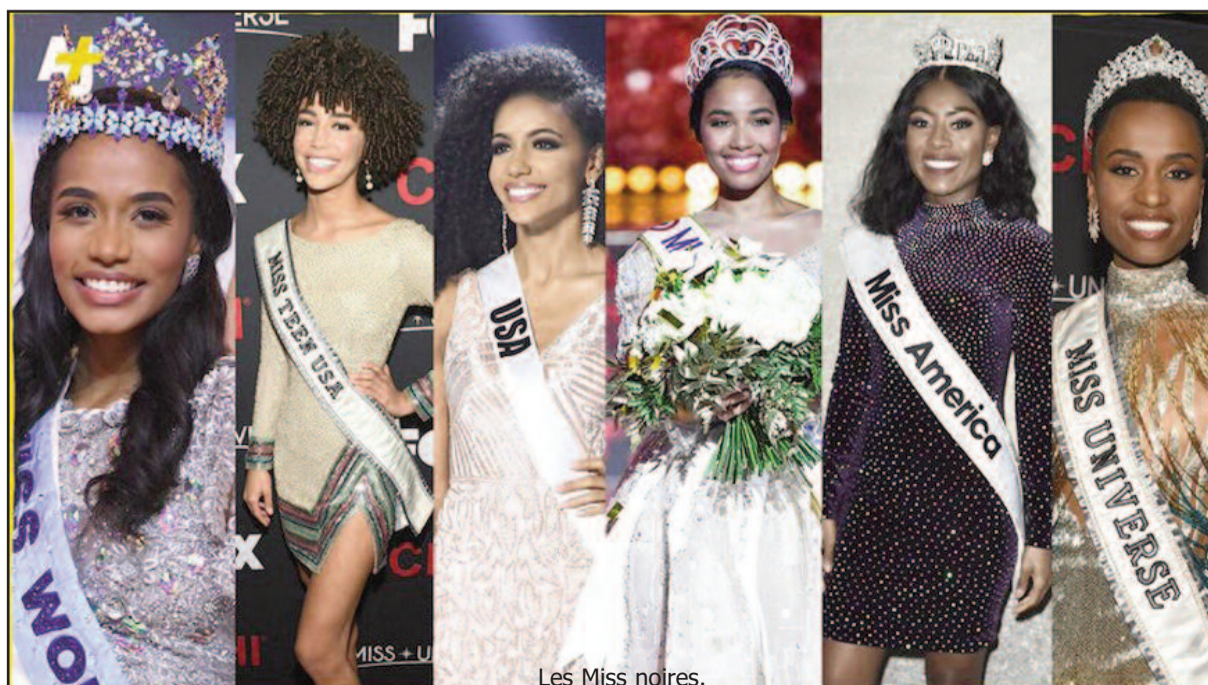
Les Miss noires.