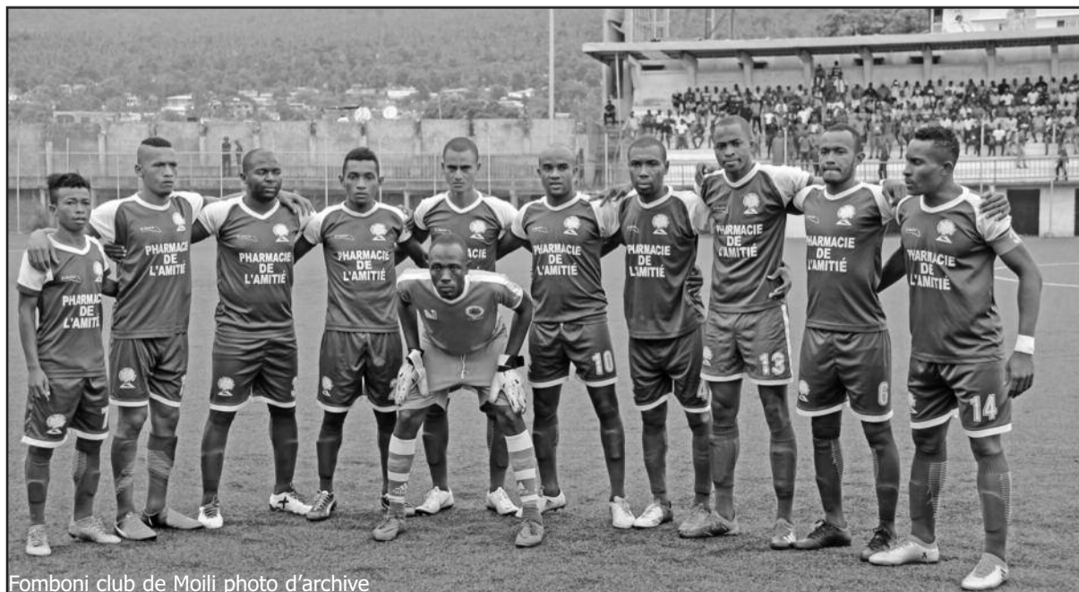
Fomboni club de Moili photo d'archive

Classement général, phase aller 1/ Fomboni club (14 points) 2/ Étoile du Centre de Salamani (Djando) 3/ Ouragan de Boingoma (12) 4/ Chikabwe Club de Hanyamwada (8) 5/ Espoir Sport de Noumachoua (7) 6/ Juno club de Hoani (6) 7/ Mbatse Football Club (6) 8/ Nouvel Espoir de Wanani (3)