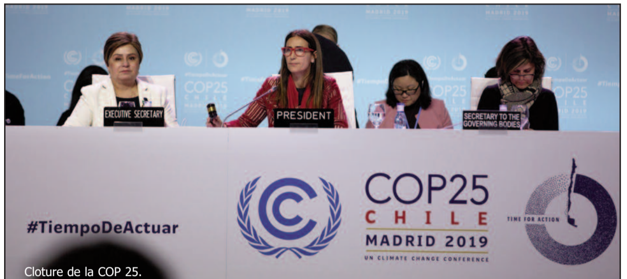
Cloture de la COP 25.

Par ailleurs, les négociateurs ne sont pas non plus parvenus à un résultat sur les marchés du carbone et l'article 6 de l'Accord de Paris. Au cours des dernières heures de négociation, plus de 30 Gouvernements se sont ralliés aux « principes de San Jose » dans le but de préserver l'intégrité des règles du marché du carbone et d'éviter les failles et la capacité de double comptabilisation des crédits.