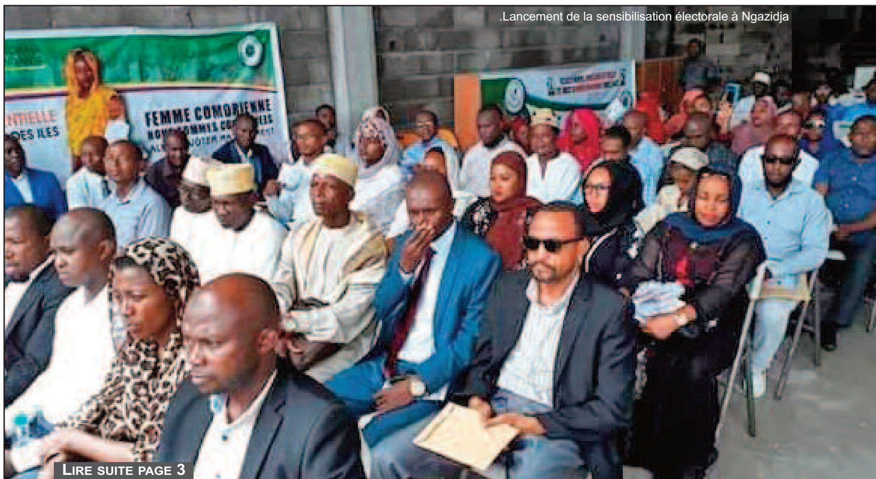
Lancement de la sensibilisation électorale à Ngazidja