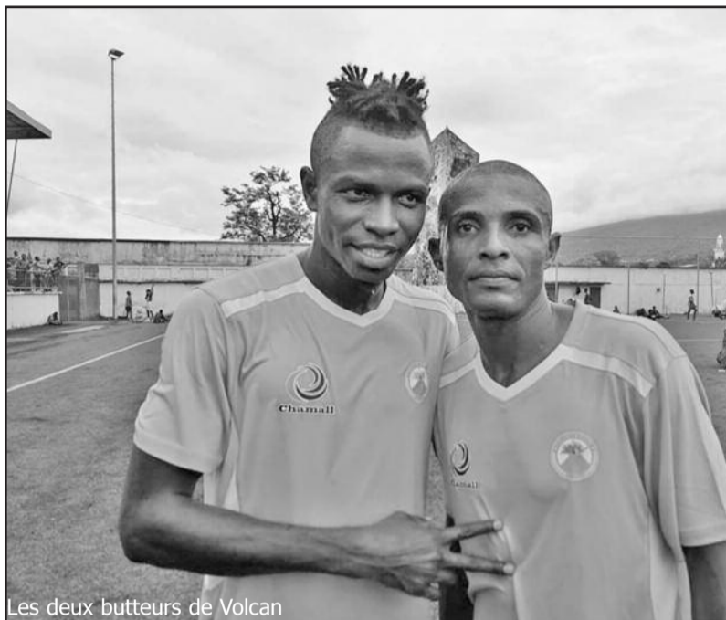
Les deux butteurs de Volcan