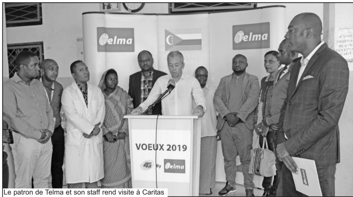
Le patron de Telma et son staff rend visite à Caritas

Ce dernier a rajouté que nul doute que cet engagement aura servi