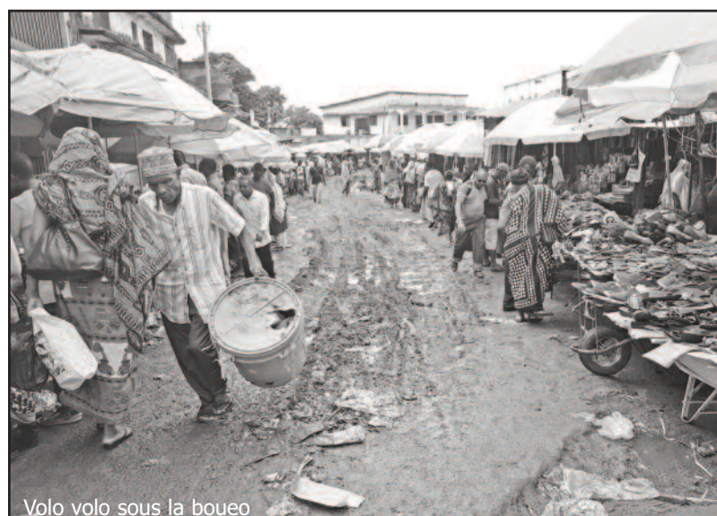
Volo volo sous la boue