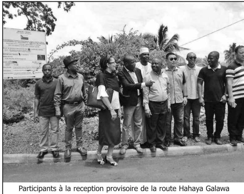
Participants à la reception provisoire de la route Hahaya Galawa