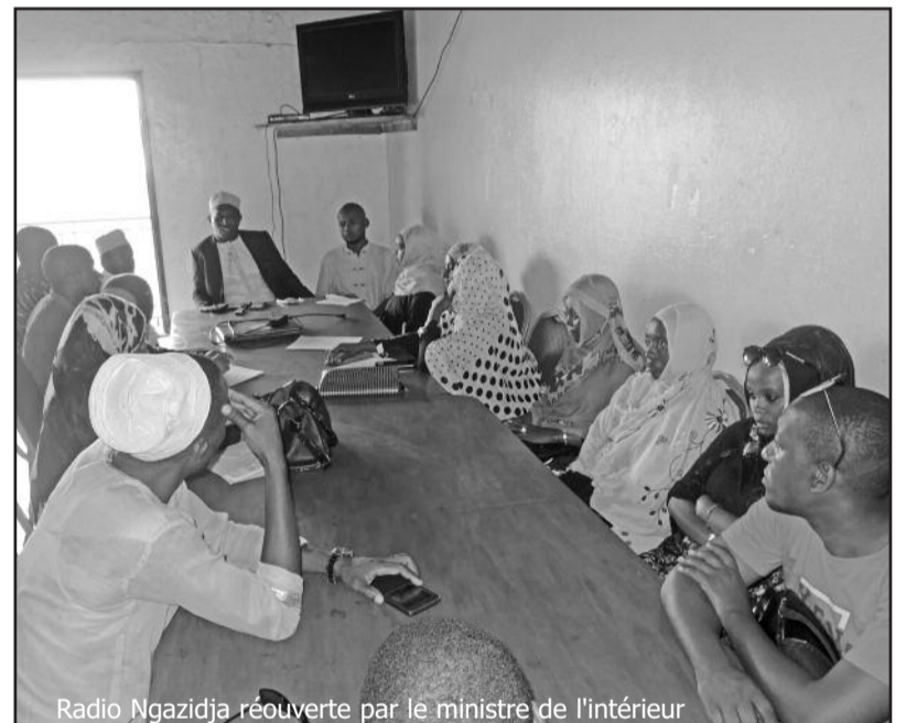
Radio Ngazidja réouverte par le ministre de l'intérieur