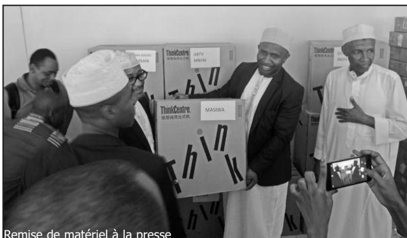
Remise de matériel à la presse