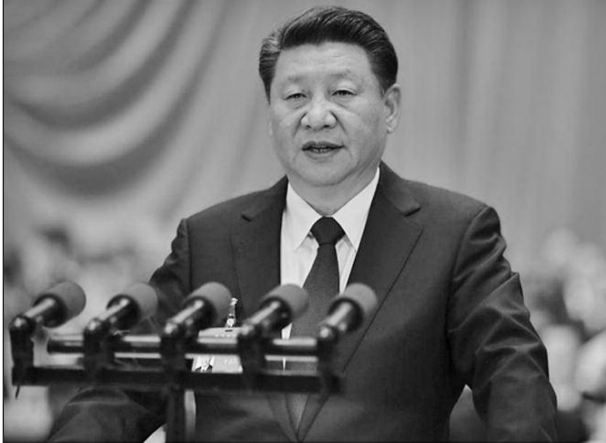
Le Président chinois, Xi Jinping

Lors de son allocution, Xi Jinping a présenté les deux étapes de son plan pour le développement de son pays : « s'efforcer de réaliser principalement la modernisation socialiste de 2020 à 2035 » et « faire de la Chine un grand pays socialiste moderne de 2035 au milieu du siècle ».