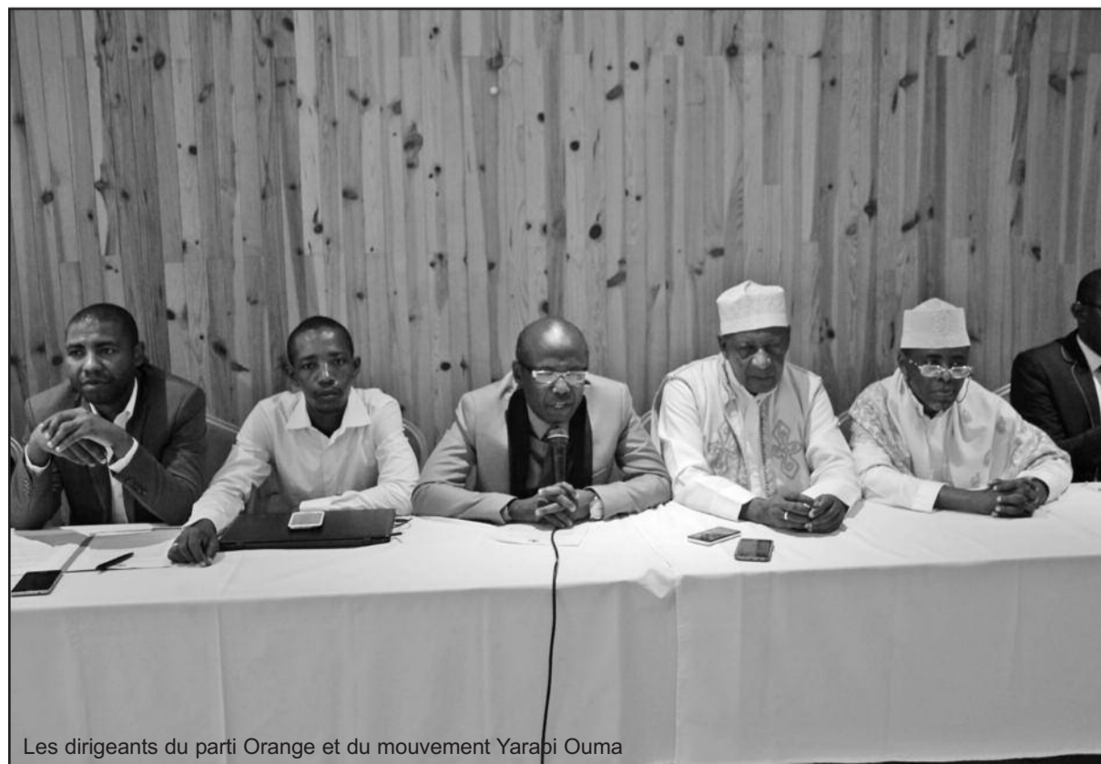
Les dirigeants du parti Orange et du mouvement Ya Roibi Ouma