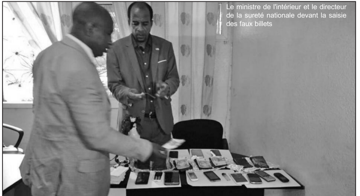
Le ministre de l'intérieur et le directeur de la sûreté nationale devant la saisie des faux billets

Enfin il est porté à la connaissance de la population que la police nationale est chargée de veiller à l'application de cette nouvelle mesure et que des sanctions seront prises contre les contrevenants.