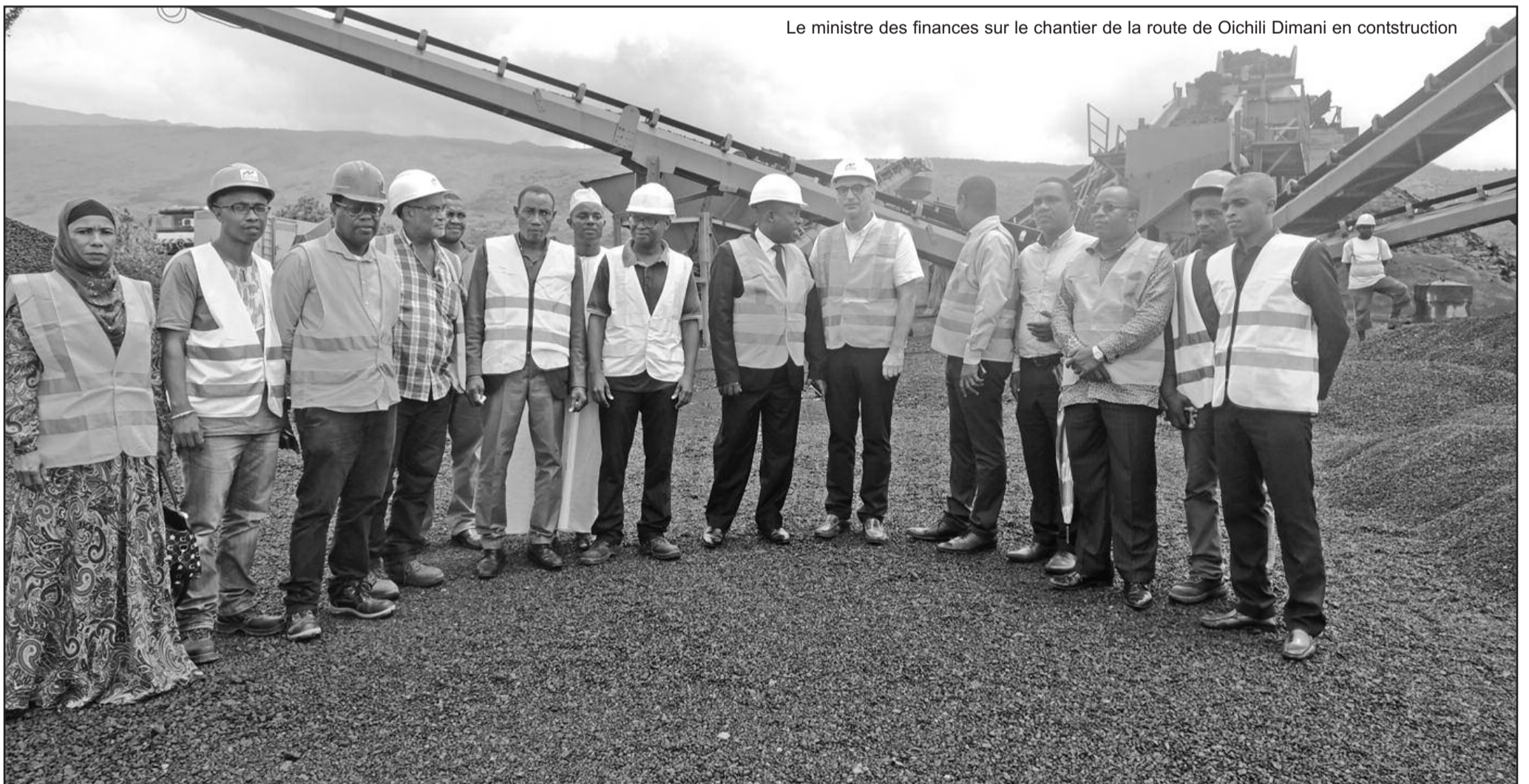
Le ministre des finances sur le chantier de la route de Oichili Dimani en construction