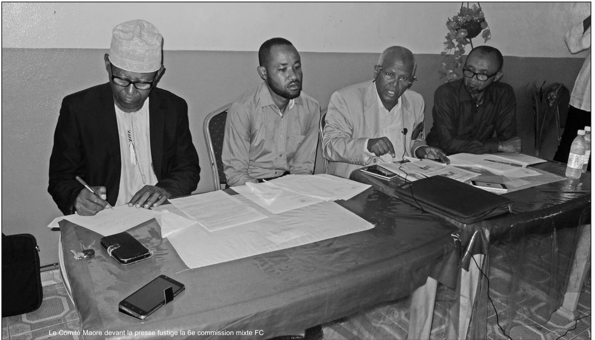
Le Comité Maore devant la presse fustige la 6e commission mixte FC