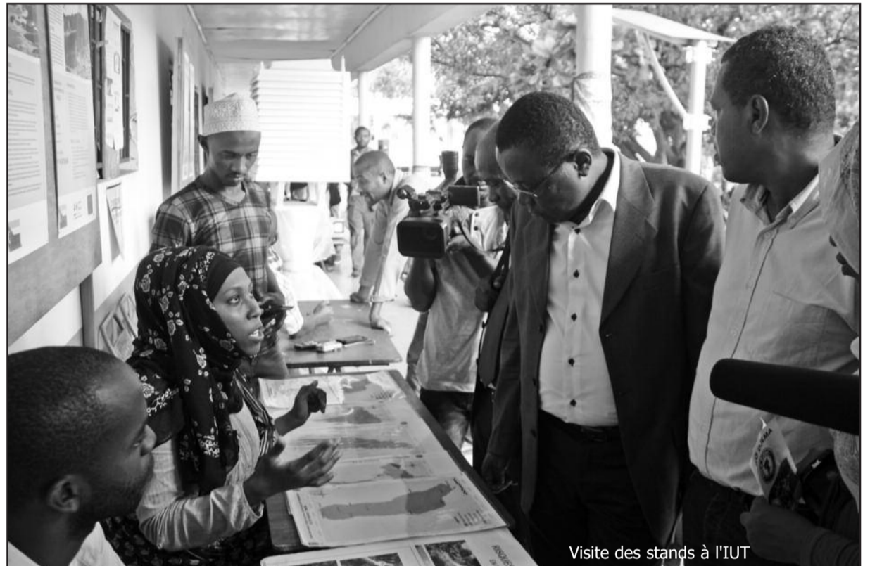
Visite des stands à l'IUT

L'objectif global de ce programme est de contribuer aux efforts de l'Union des Comores en matière de développement et de lutte contre la pauvreté à travers un renforcement de la résilience du pays au changement climatique. L'action du programme