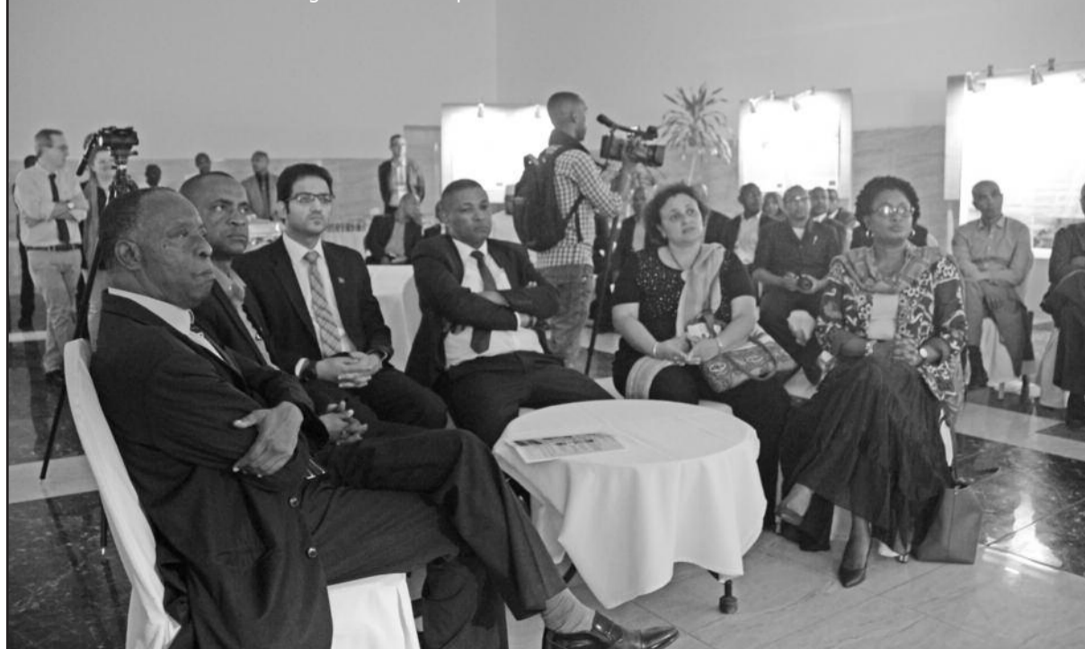
Journée de lutte contre le changement climatique