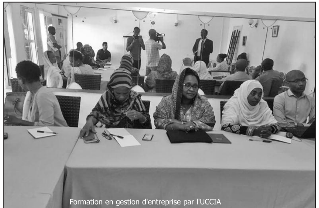
Formation en gestion d'entreprise par l'UCCIA

Le deuxième thème abordé est la réussite de la mobilisation de sources de financement pour le développement d'une activité. Un thème axé sur l'identification et l'analyse de différentes sortes de financement, la transformation des contraintes des femmes entrepreneures des Comores en atout pour les institutions de micro finance ou encore le dévelop-