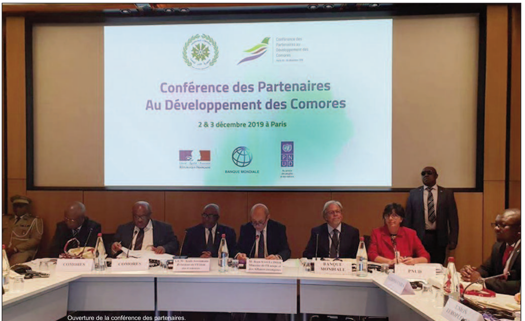
Ouverture de la conférence des partenaires.

Le tribunal ordonne à l'ANRTIC le sursis à l'exécution de sa décision