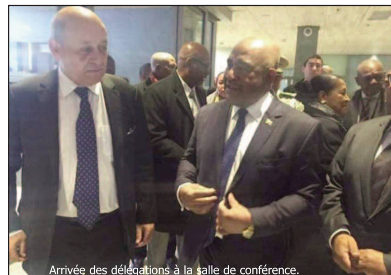
Arrivée des délégations à la salle de conférence.

Les États présents, les organisations régionales et internationales et les partenaires techniques et financiers ont, à l'unanimité, salué les ambitions affichées par l'État comorien en matière de développement, estimant que les îles Comores présentent des potentialités susceptibles de contribuer à la croissance et au développement humain. « C'est pour l'émergence des Comores que nous devons travailler ensemble », avance Jean Yves Le Drian, peu avant l'ouverture officielle de la conférence par le chef de l'État, Azali Assoumani. Dans son mot, le chef de la diplomatie française, représentant Emmanuel Macron, a lancé un appel à la communauté internationale à soutenir les Comores, félicitant le pays d'avoir élaboré un plan de développement ambitieux. « Les besoins de financement sont élevés mais ils sont à la hauteur des ambitions des autorités comoriennes », souligne Jean Yves Le Drian.