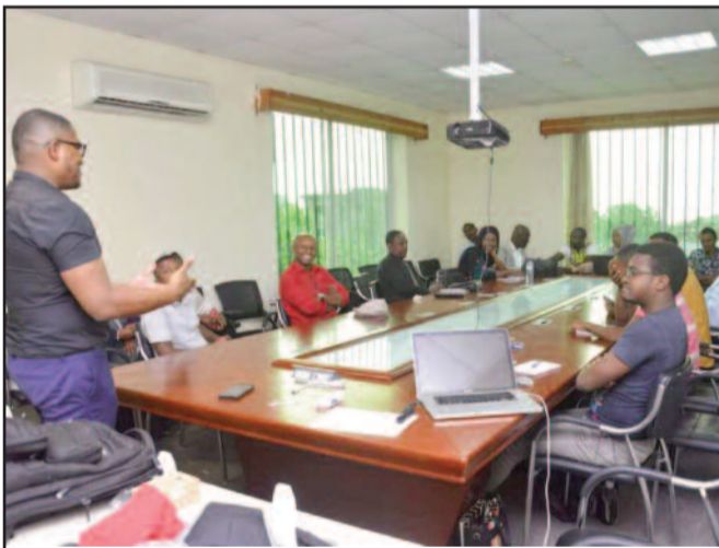
Formation des jeunes au commerce en ligne.

Dans le but de mettre en pratique la vente en ligne aux Comores, la société COMTRYVANCE a initié hier lundi, une formation sur l'e-commerce et e-business afin de pousser les jeunes porteurs de projets concrets à se lancer dans la vente en ligne afin d'avoir une bonne approche et engranger des gains d'une manière rapide et accessible.