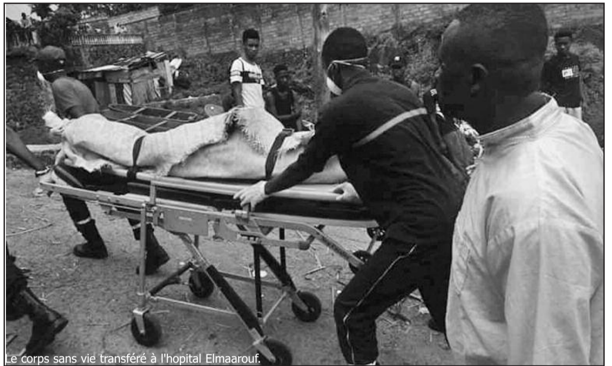
Le corps sans vie transféré à l'hôpital Elmaarouf.

avons travaillé sur un projet d'incinérateur, et même son financement était acquis mais jusqu'aujourd'hui rien n'a avancé » conclut il.