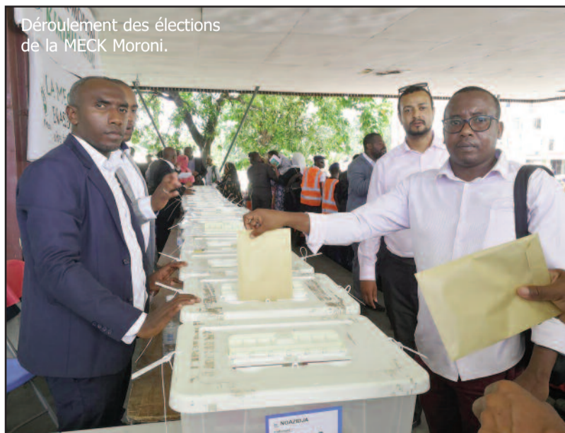
Déroulement des élections de la MECK Moroni.