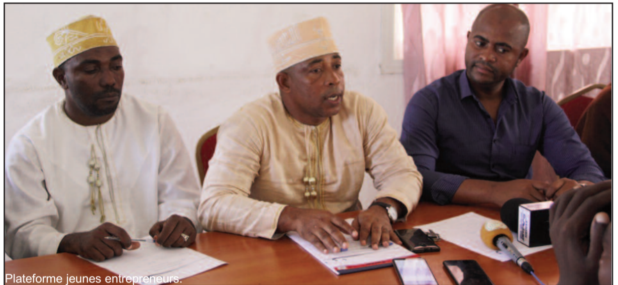
Plateforme jeunes entrepreneurs.

En plus, la Plateforme constate que la création d'entreprises est un projet qui demande des fonds, de la préparation des décisions importantes donc de la persévérance. Toutefois, les conférenciers rassurent qu'il n'est pas évident que le décideur et porteur du projet soit à la hauteur de sa réalisation. Raison pour laquelle, le président de la plateforme des jeunes entrepreneurs,