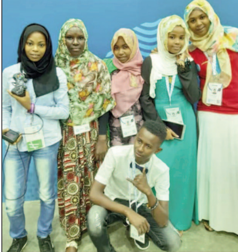
Représentants des Comores au concours de robotique à Dubaï.