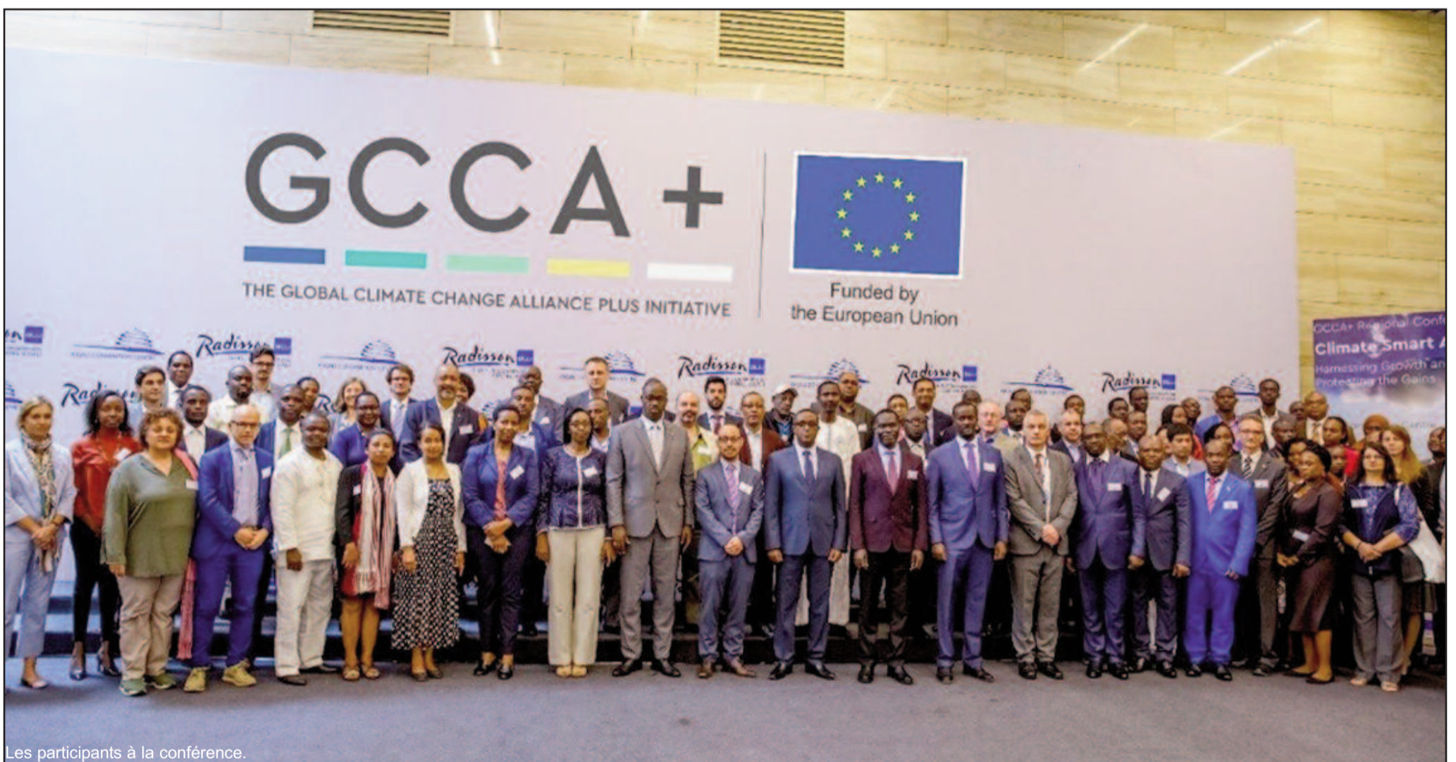
Les participants à la conférence.

D u 15 au 18 octobre dernier, s'est tenu à Kigali, au Rwanda, une conférence régionale organisée par l'Alliance Mondiale contre le Changement Climatique (AMCC), conjointement avec l'IUCN (International Union for the Conservation of Nature) – sur financement européen. Plus d'une centaine de gestionnaires de projets européens, directeurs et hauts cadres de l'environnement de dizaines de pays afri-