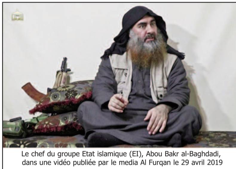
Le chef du groupe Etat islamique (EI), Abou Bakr al-Baghdadi, dans une vidéo publiée par le media Al Furqan le 29 avril 2019

Le "calife" territorial de l'EI a été déclaré défait par les Américains en mars dans son dernier réduit en