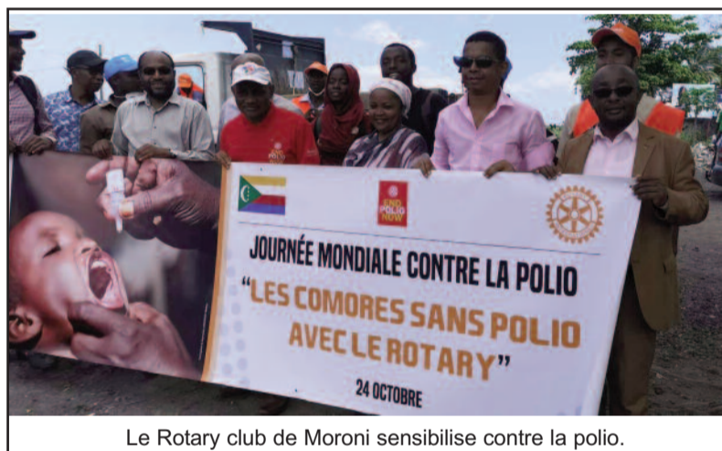
Le Rotary club de Moroni sensibilise contre la polio.

Face à cette situation, les Rotariens agissent localement à travers diverses actions caritatives, mais aussi à travers le monde, pour