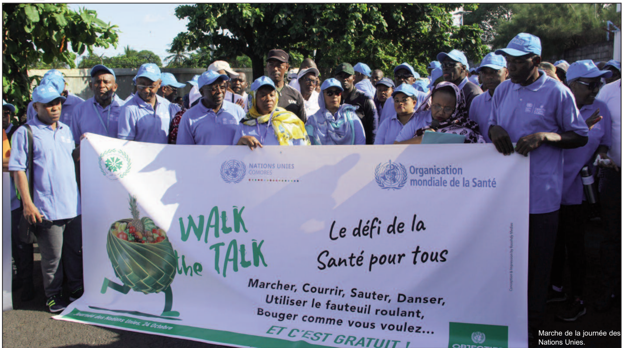
Marche de la journée des Nations Unies.

Dans le cadre du 74 ème anniversaire des Nations-Unies, une marche pacifique et festive a été organisée à Moroni, allant de la Maison des Nations-Unies jusqu'au au rond-point du Café du Port. Les parties prenantes comme le SNU, organisateur de la marche, le gouvernement comorien, les associations et la Mairie de Moroni ont applaudi la mobilisation. Ces derniers espèrent que cette action n'est que « le point de départ de l'implication effective de tous pour faire de notre pays un exemple de propreté ».