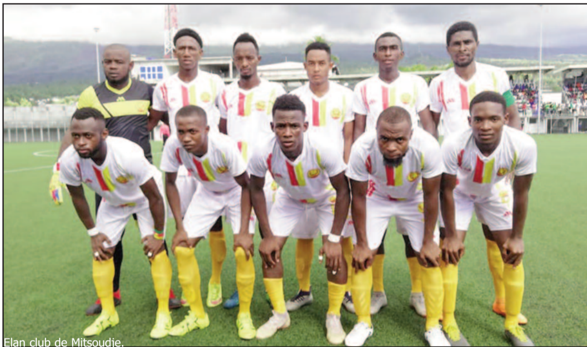
Élan club de Mitsoudje.