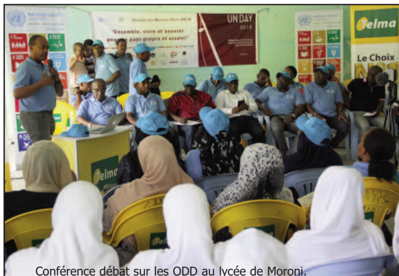
Conférence débat sur les ODD au lycée de Moroni.

11 parle de la vie durable, la réduction de l'impact environnemental et de la gestion des déchets. C'est un engagement que se donnent plusieurs pays y compris les Comores, qui implique le soutien des Nations Unies afin de l'atteindre ».