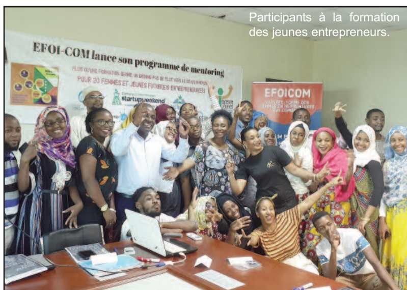
Participants à la formation des jeunes entrepreneurs.