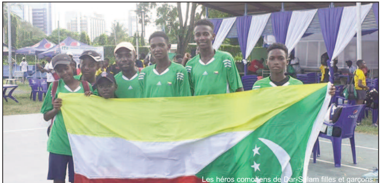
Les héros comoriens de Dar-Salam filles et garçons.

Parallèlement à la compétition, les Comores occupent suite à des élections, le secrétariat général de la Confédération Est-africaine de Tennis pour un mandat de 4 ans. Exceptés Djibouti, Éthiopie et Soudan, tous les autres pays de l'Afrique de l'Est (neuf) ont partici-