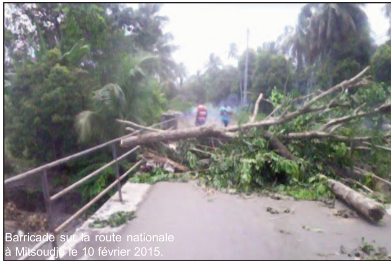
Barricade sur la route nationale à Mitsoudjé le 10 février 2015.

« Résultat, un mur de protection à la place de Bagani a été détruit par l'AND et des jeunes ont été arrêtés puis libérés quelques heures après. Et le 10 février, on a vécu une journée tragique car on a eu une douzaine de blessés dont trois étaient dans un état grave. Ces jeunes étaient victimes, d'une affaire de Trembo (de l'alcool artisanal, Ndlr) dont ils