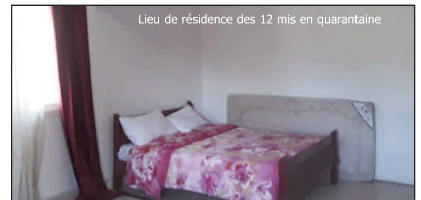
Lieu de résidence des 12 mis en quarantaine

Lundi, le ministère de la santé avait assuré devant la presse être