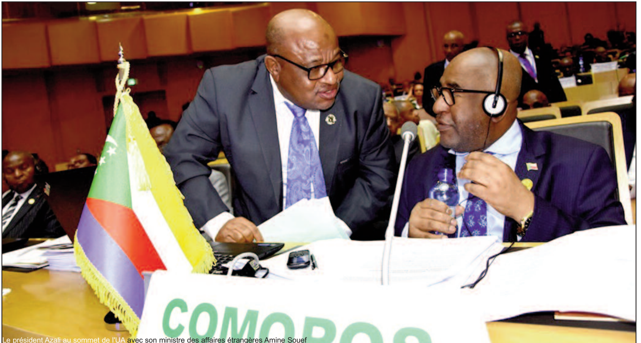
Le président Azali au sommet de l'UA avec son ministre des affaires étrangères Amine Souef