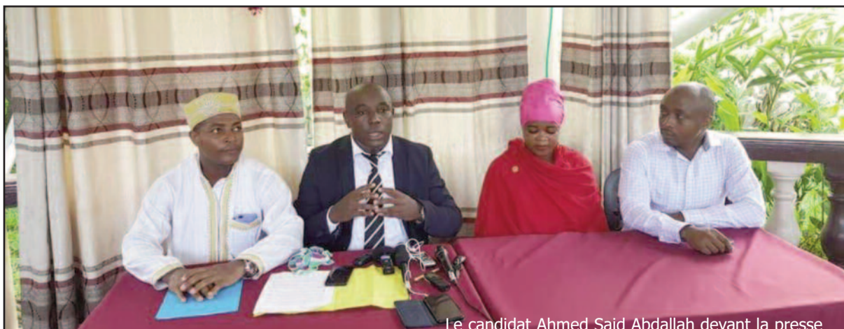
Le candidat Ahmed Said Abdallah devant la presse