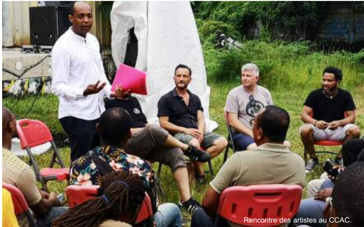
Rencontre des artistes au CCAC.

En tournée pour la présentation de son nouvel album, "Amani Way" sorti en septembre 2019, Eliasse Ben Joma était de passage à Moroni pour un concert qui a eu lieu au Centre Culturel et Artistique des Comores (CCAC-Mavuna). L'occasion pour l'artiste au talent international de rencontrer les artistes locaux. Une discussion sous le thème « être un artiste est un métier » a permis aux artistes de réfléchir comment mettre en valeur le métier d'artiste aux Îles de la Lune. Bien qu'indirectement, cette rencontre s'inscrit dans le cadre d'un travail de validation du Rapport Périodique Quadriennal (RPQ) de l'UNESCO en cours en Union des Comores avec comme objectif de voir les voies et moyens de formalisation du secteur artistique. De part et d'autre, les acteurs