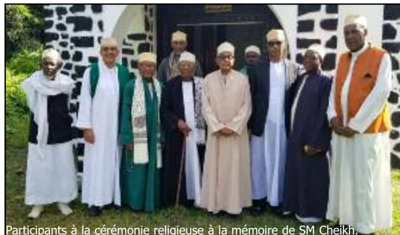
Participants à la cérémonie religieuse à la mémoire de SM Cheikh.