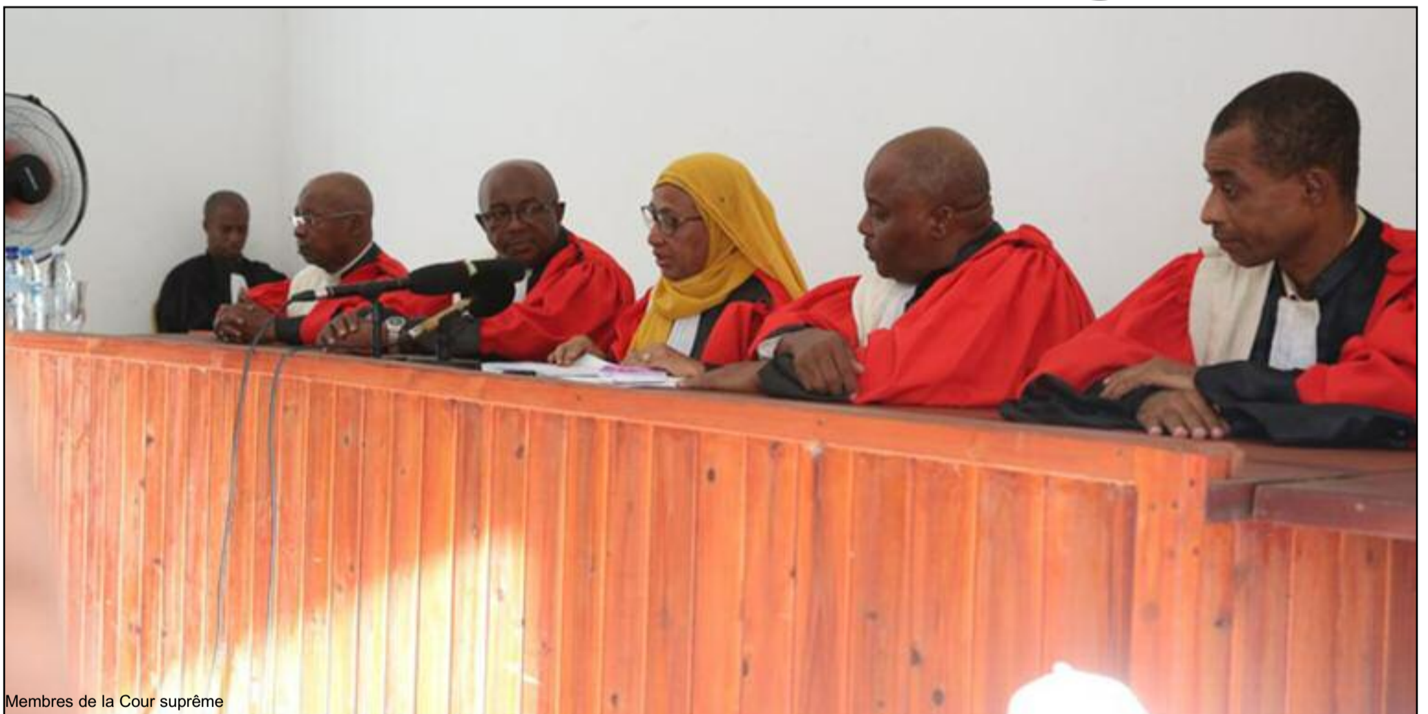
Membres de la Cour suprême