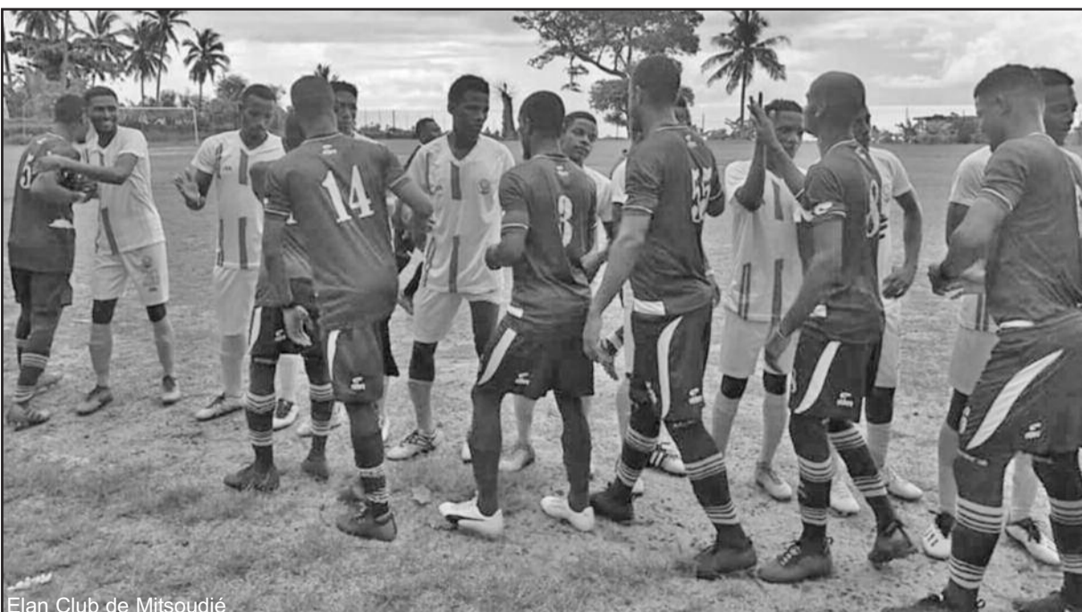
Élan Club de Mitsoudje