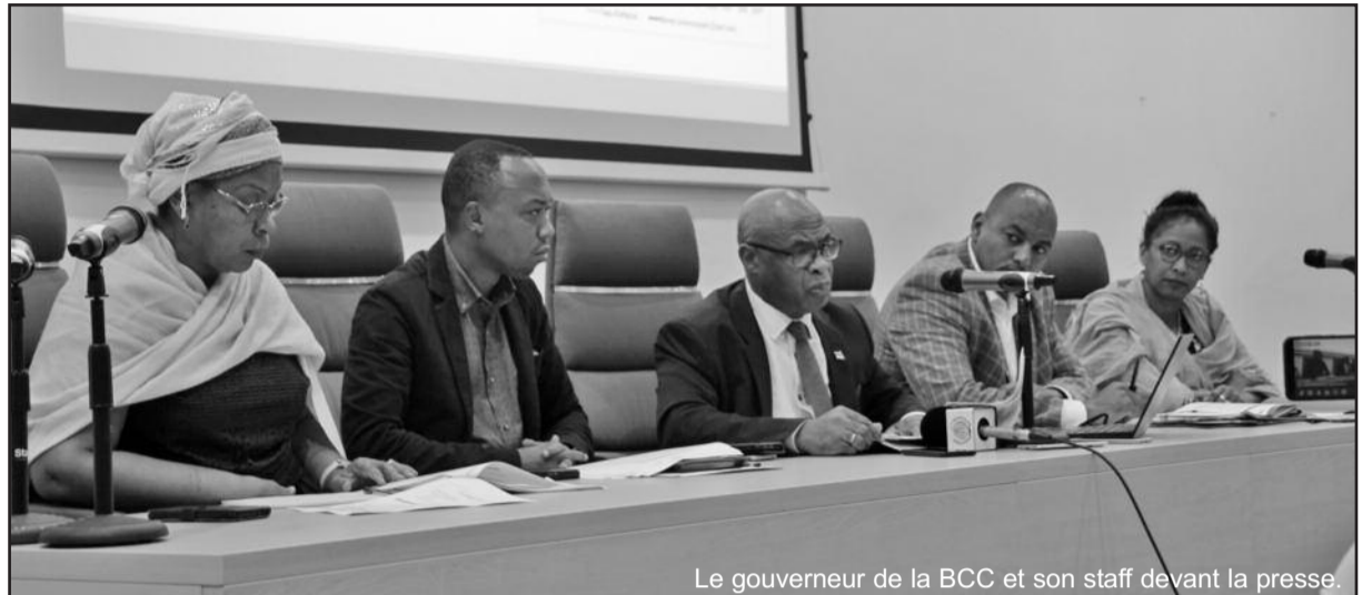
Le gouverneur de la BCC et son staff devant la presse.

« Les repreneurs des banques viennent avec des plans d'affaires. De notre côté, nous nous basons sur les critères d'établissement pour donner l'agrément. Et s'il répond aux critères demandés et qu'il a en même temps négocié avec BNP Paribas, il aura son agrément », explique-t-il, avant d'a-