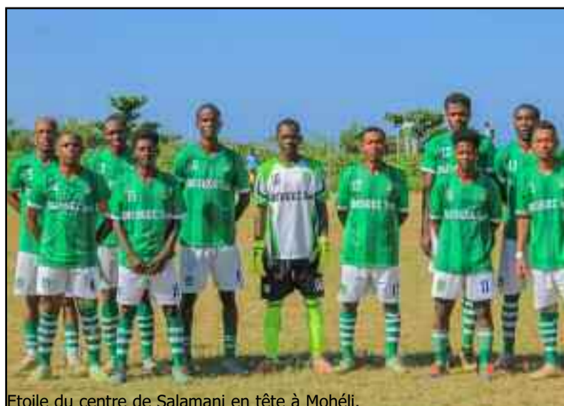
Étoile du centre de Salamani en tête à Mohéli.

12 points pour Étoile de centre actuellement en tête du classement devant Mbatsé Club (7 points) et Belle lumière (7 points). Cette dernière vient de concéder ce samedi à Hoani un match nul (1-1) contre Juno Club qui totalise 4 points au bas de l'échelle. L'après-midi de ce dimanche Fomboni Fc qui a fait un début difficile avec 5 points recevait Ouragan Club de Bangoma (4 points). Le deuxième match de ce dimanche opposait FCN Espoir de Nioumachoi, 6 points actuellement après avoir battu à domicile Étoile du centre (1-0) en match de retard, et Coca bolé de Wanani (4 points) à Nioumachoi.