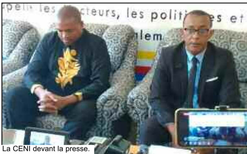
La CENI devant la presse.