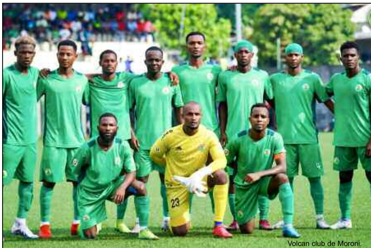
Volcan club de Moroni.

A la deuxième place on retrouve trois équipes avec le même nombre de points (8). Etoile des Comores qui pouvait s'emparer de la première place tout comme