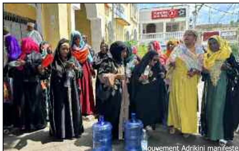
Mouvement Adrikini manifeste.

veuve de l'ancien premier ministre Abbas Djoussouf, monte au créneau : « On nous a roulés dans la farine.