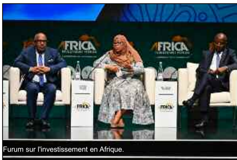
Forum sur l'investissement en Afrique.

Devant cette assemblée, le président Azali a encore parlé de la ZLECAF. « Le développement industriel de l'Afrique peut avoir une meilleure intégration dans les CVM en parlant de la Zone de