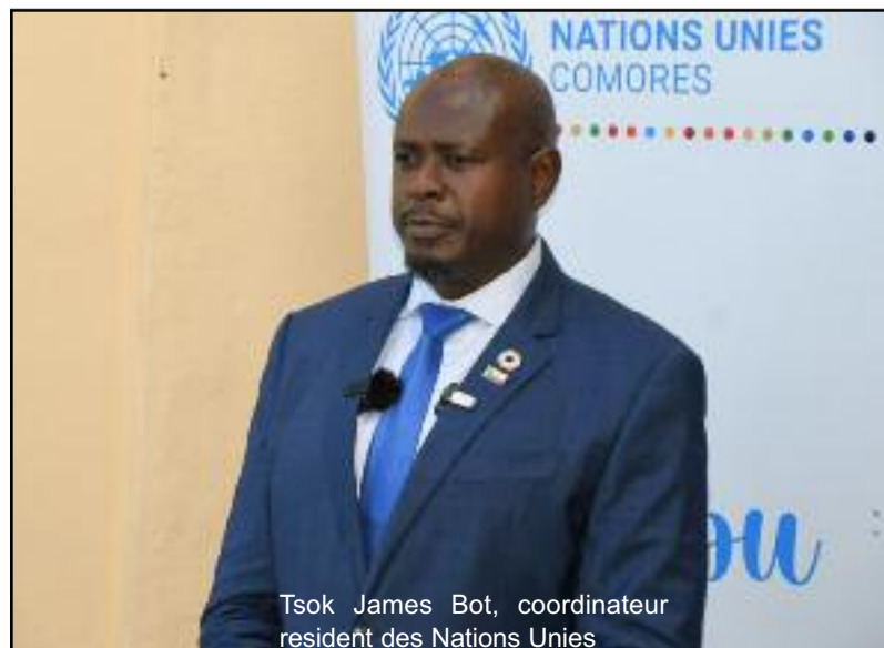
Tsok James Bot, coordinateur résident des Nations Unies

le gouvernement comorien continue de mobiliser des fonds auprès des institutions financières internationales (Banque mondiale, FMI, BAD, BID) essentiellement fléchés vers les infrastructures.