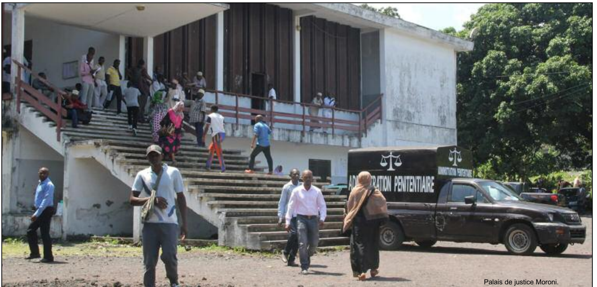
Palais de justice Moroni.