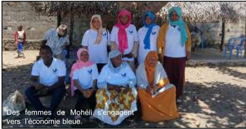
Des femmes de Mohéli s'engagent vers l'économie bleue.

pour les populations, le climat et la nature), cette activité constitue aujourd'hui une véritable source d'autonomisation économique pour de nombreuses femmes. En transformant et en valorisant les ressources marines locales, elles contribuent à la fois à l'amélioration de leurs revenus et à la promotion d'une gestion durable des ressource