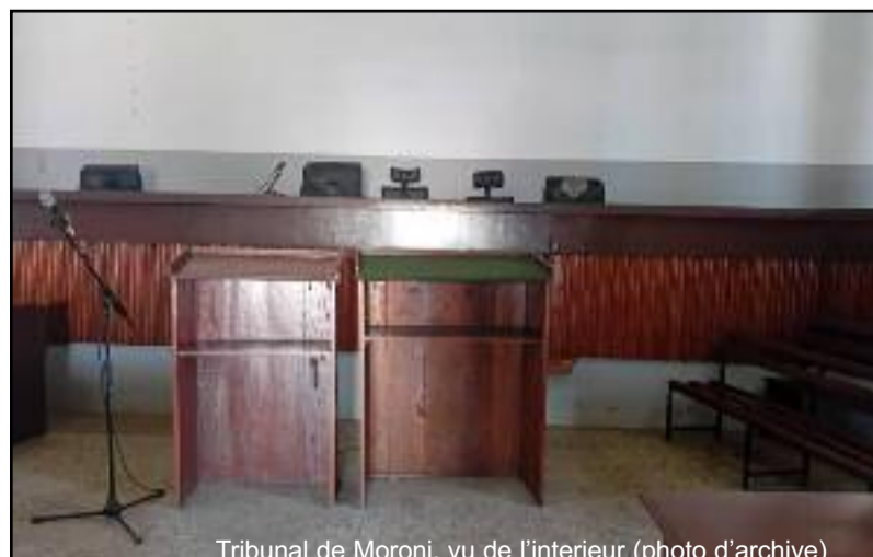
Tribunal de Moroni, vu de l'intérieur