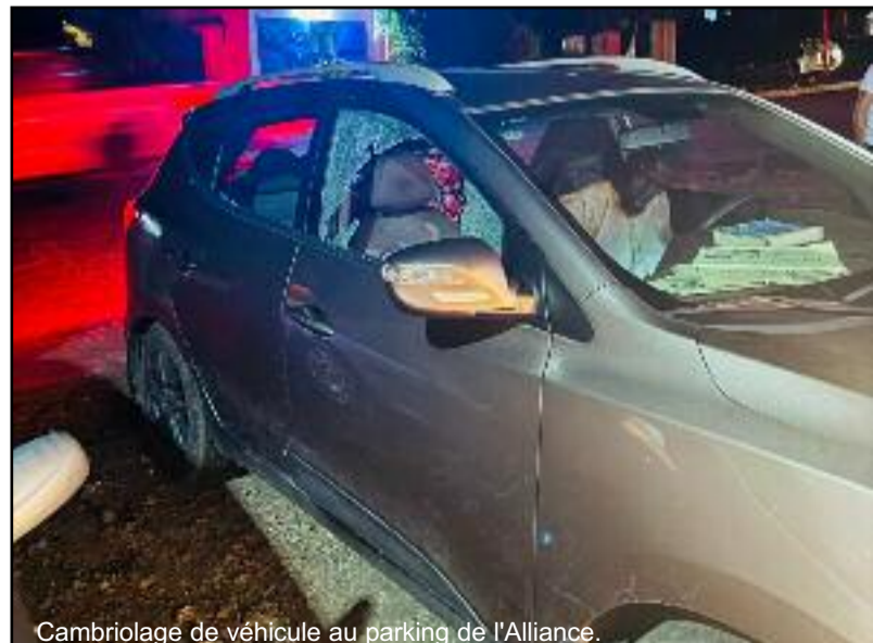
Cambriolage de véhicule au parking de l'Alliance.