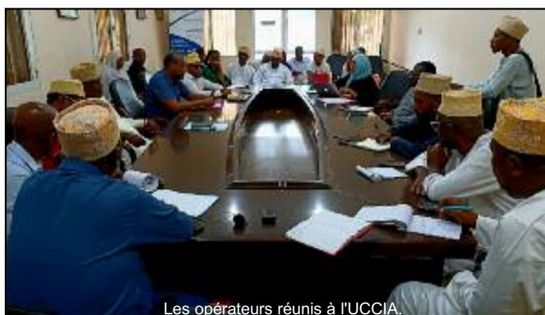
Les opérateurs réunis à l'UCCIA.