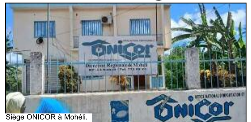
Siège ONICOR à Mohéli.

cées par certains responsables de l'ONICOR, plusieurs versions circulent. L'une d'elles évoque une cargaison qui appartiendrait à une banque. Une autre affirme que cette commande aurait été passée sous la direction actuelle, tandis que celles effectuées sous l'ancienne direction devraient suivre un traitement différent. Des arguments qui peinent à