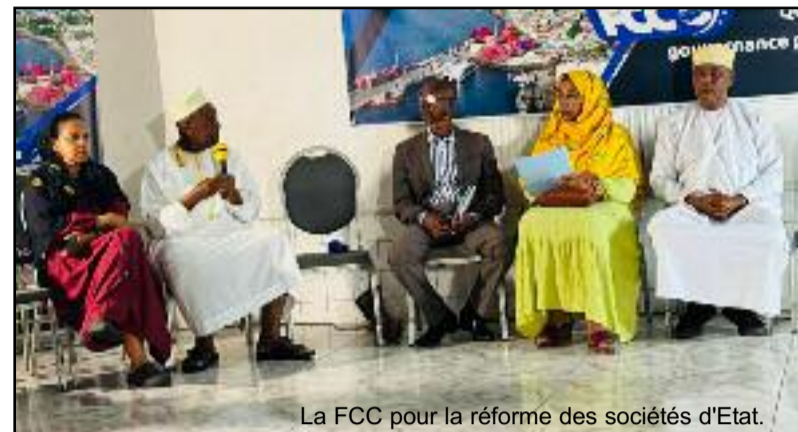
La FCC pour la réforme des sociétés d'Etat.