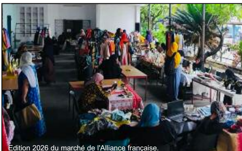
Edition 2026 du marché de l'Alliance française.