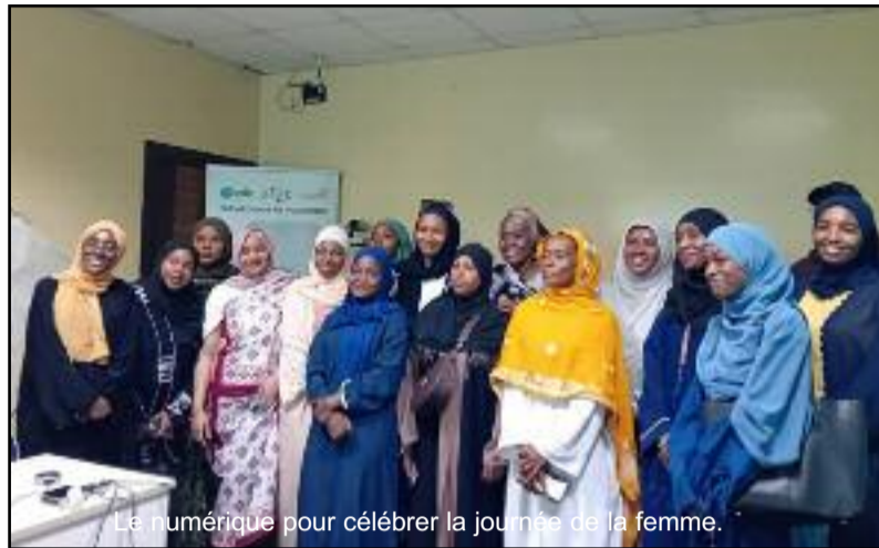
Le numérique pour célébrer la journée de la femme.