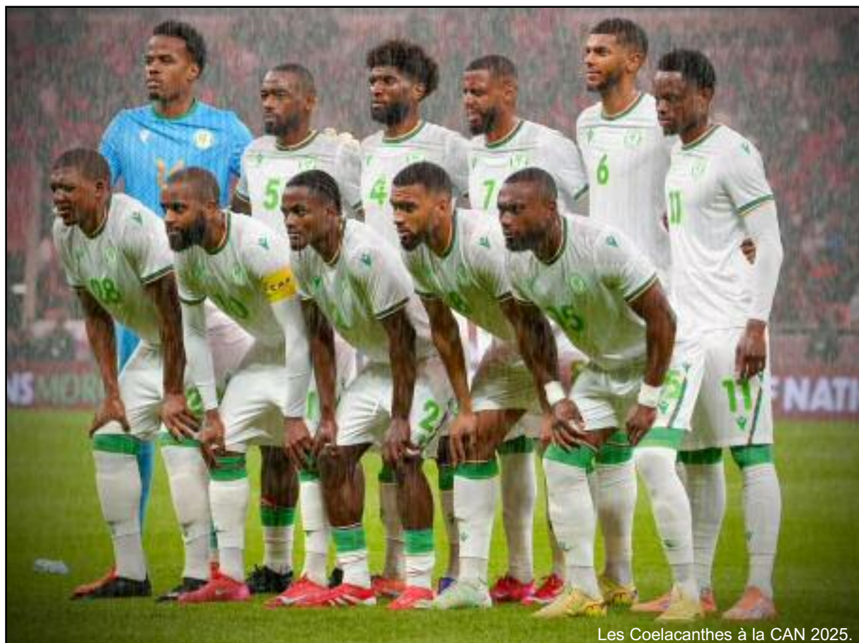
Les Cœlacanthes à la CAN 2025.

Une analyse qui colle parfaitement avec les chiffres de la rencontre, largement dominée par le Maroc, avec une possession de balle de 71%. Malgré cette domination, les Cœlacanthes n'ont à aucun