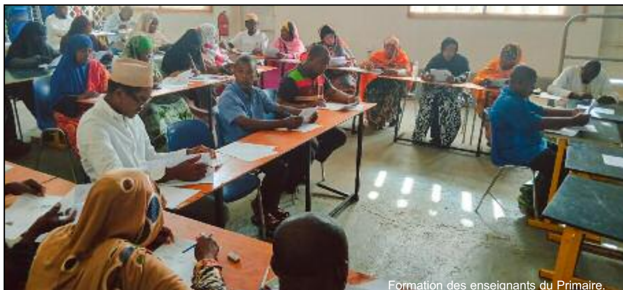
Formation des enseignants du Primaire.