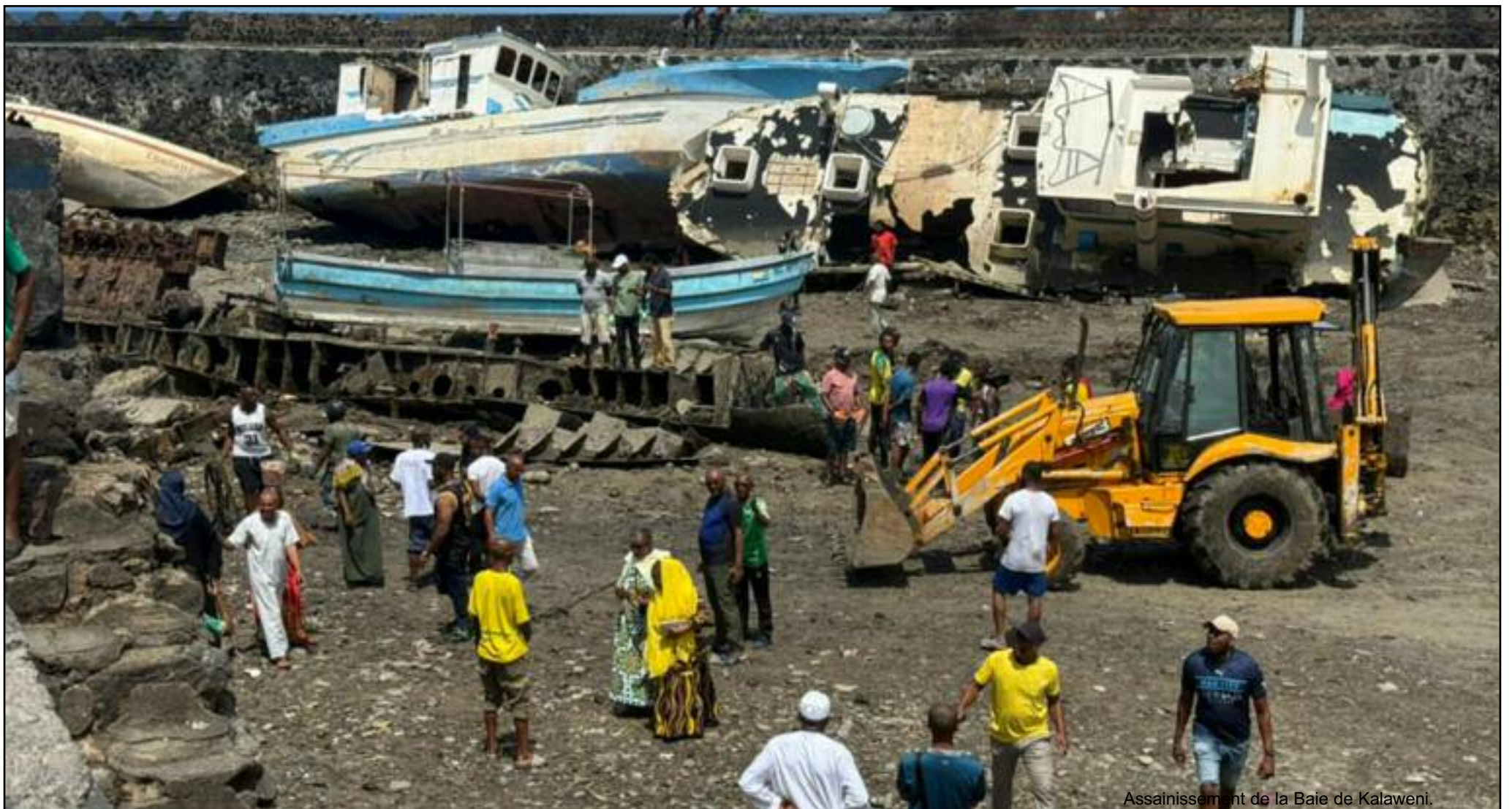
Assainissement de la Baie de Kalaweni.