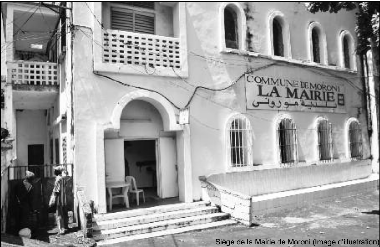
Siège de la Mairie de Moroni (Image d'illustration)