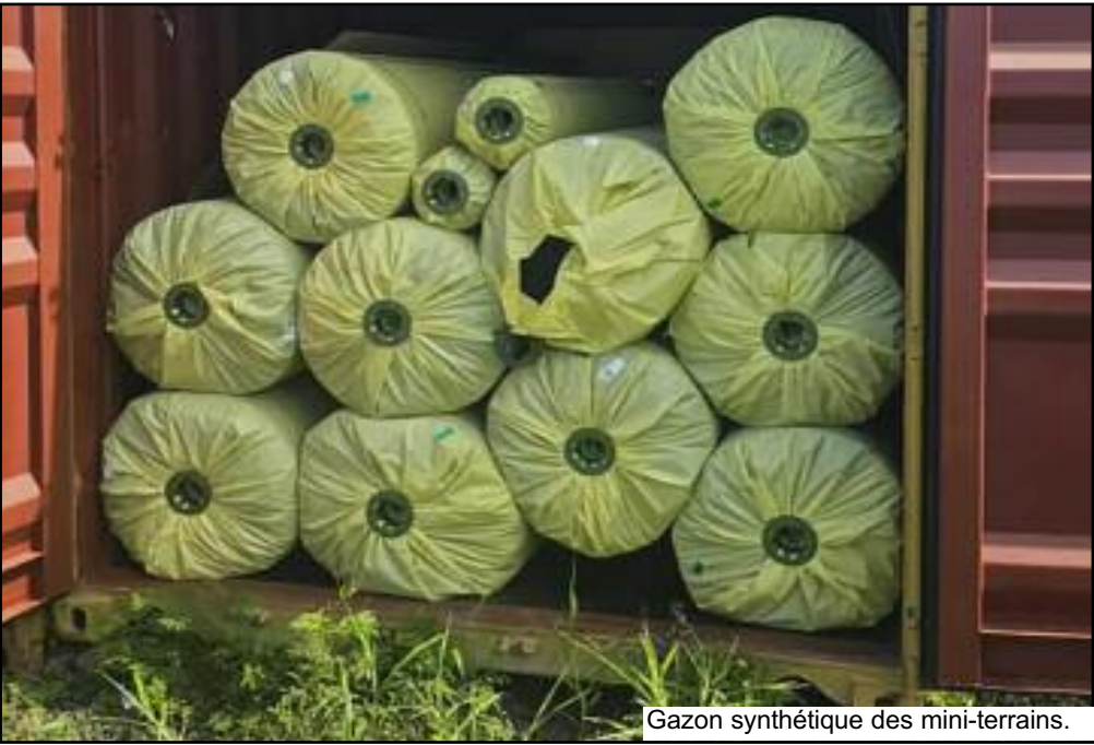
Gazon synthétique des mini-terrains.