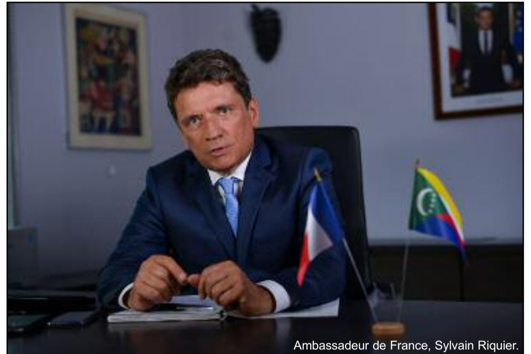
Ambassadeur de France, Sylvain Riquier.

La protection de l'Océan passe également par la mobilisation des financements publics et privés et le soutien à une économie bleue durable. Pour continuer à bénéficier des formidables opportunités économiques de l'Océan, nous devons faire en sorte que les ressources marines puissent se régénérer. A Nice,