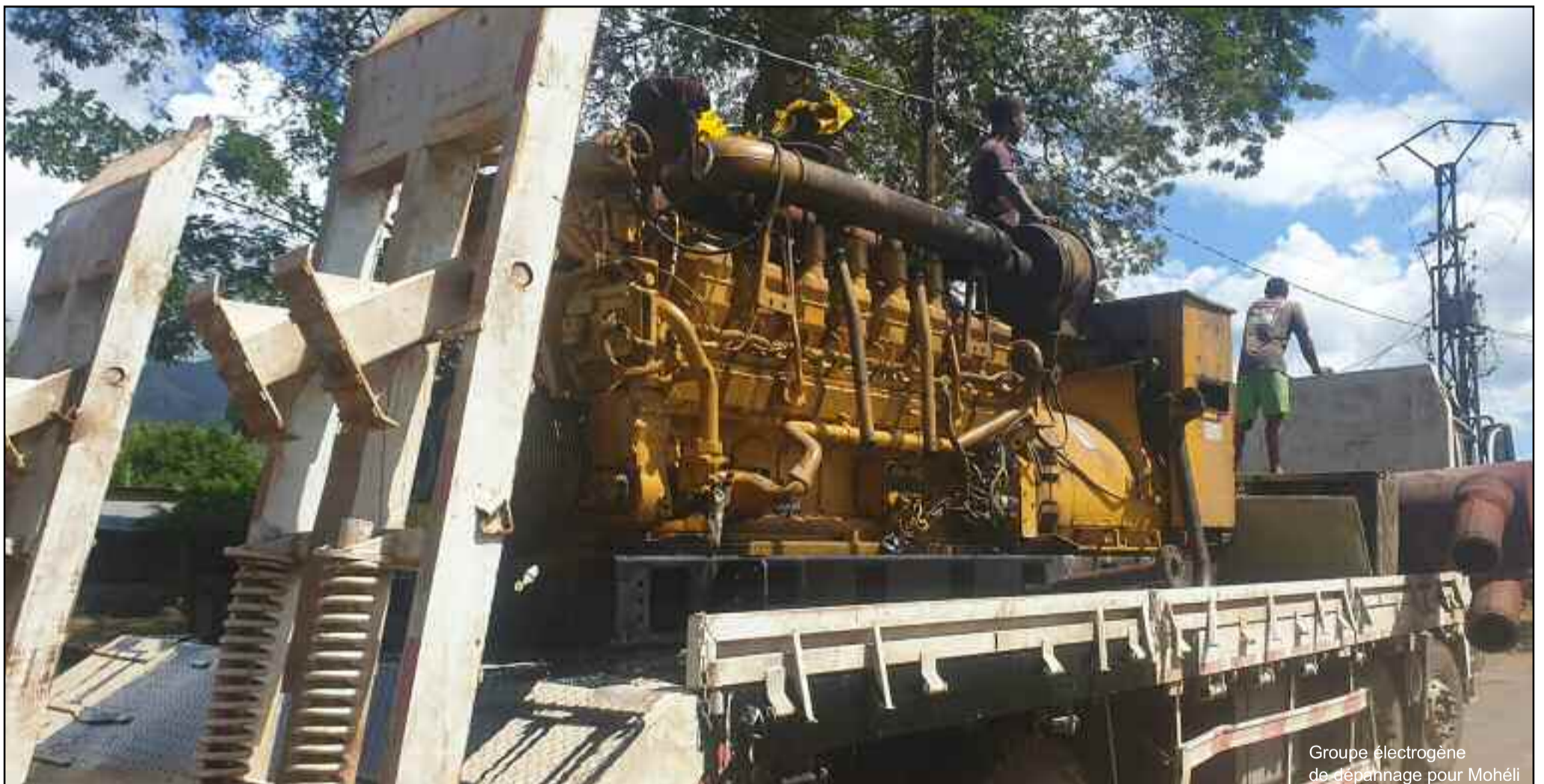
Groupe électrogène de dépannage pour Mohéli