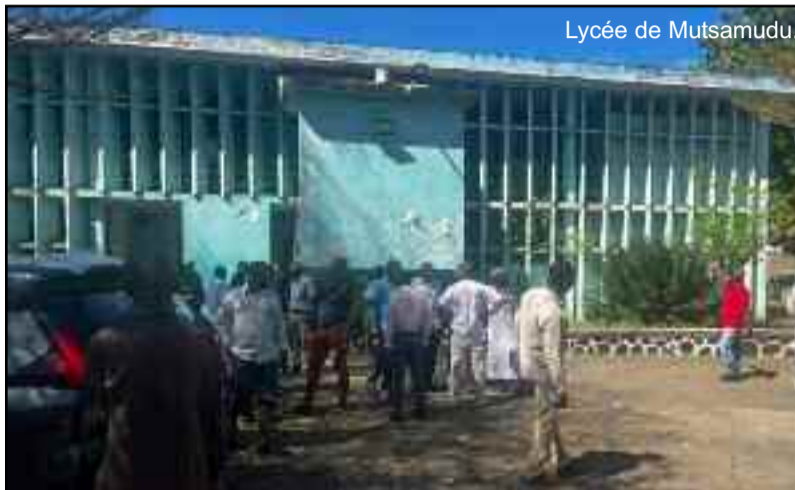
Lycée de Mutsamudu.

Les résultats du concours d'entrée en sixième font polémique à Anjouan. Plusieurs candidats sont déclarés admis sur le site internet de l'ONEC et non sur les listes affichées dans les différents établissements. D'autres figurent dans les listes et non sur le site Internet. Une situation qui provoque la colère de nombreux parents.