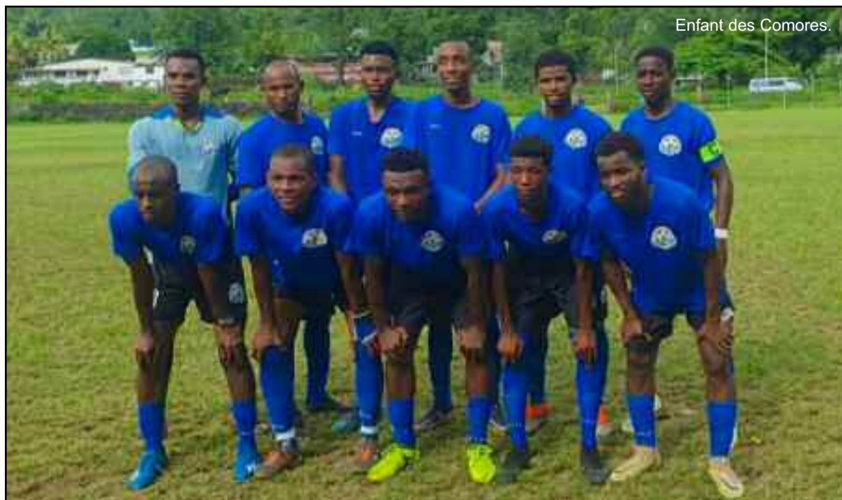
Enfant des Comores.

Du début jusqu'à la dernière journée du championnat, Enfant des Comores de Vouvouni n'a jamais trouvé la formule pour éviter une descente en division inférieure. Très loin est le temps où ce club du centre de l'île faisait la pluie et le beau temps dans le championnat régional de Ngazidja. Ombre de lui-même et incapable d'assurer un renouvellement des générations, le club de Vuvuni avait perdu ces dernières années sa force d'attraction qui faisait de lui, l'un des clubs les plus suivis du pays. Cette descente en division inférieure peut être un mal pour un bien qui va permettre aux dirigeants du club de trouver une nouvelle approche managériale pour s'adapter à la nouvelle réalité du football comorien et à un championnat de plus en plus budgétivore.