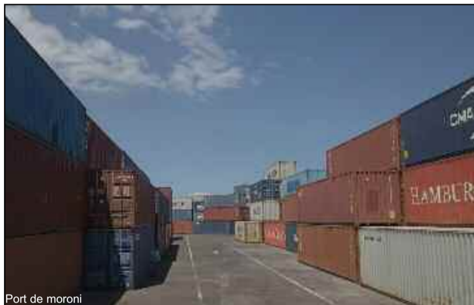
Port de moroni

L'UE est le premier marché de destination des exportations comoriennes (44,1% du total pour un montant de 7,3 M EUR). L'Union arrive largement en tête devant l'Inde (21,8%), Madagascar (7,6%) et les Etats unis (5,9%).