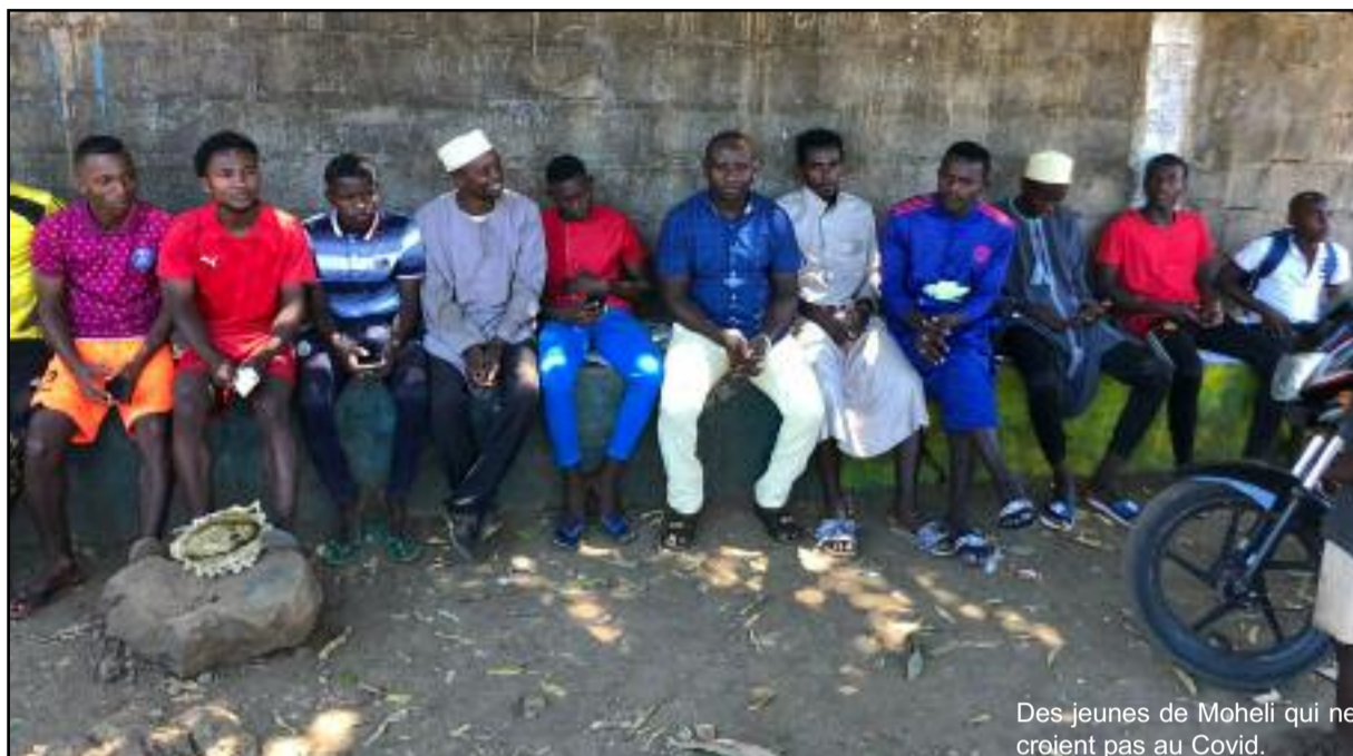
Des jeunes de Mohéli qui ne croient pas au Covid.

Pendant que la chasse aux cache-nez s'est intensifiée dans certaines localités de l'île, dans d'autres régions de Mohéli les gens vivent dans la tranquillité sans aucune mesure anti-covid-19. Certains vont jusqu'à se poser la question de savoir si les mesu-