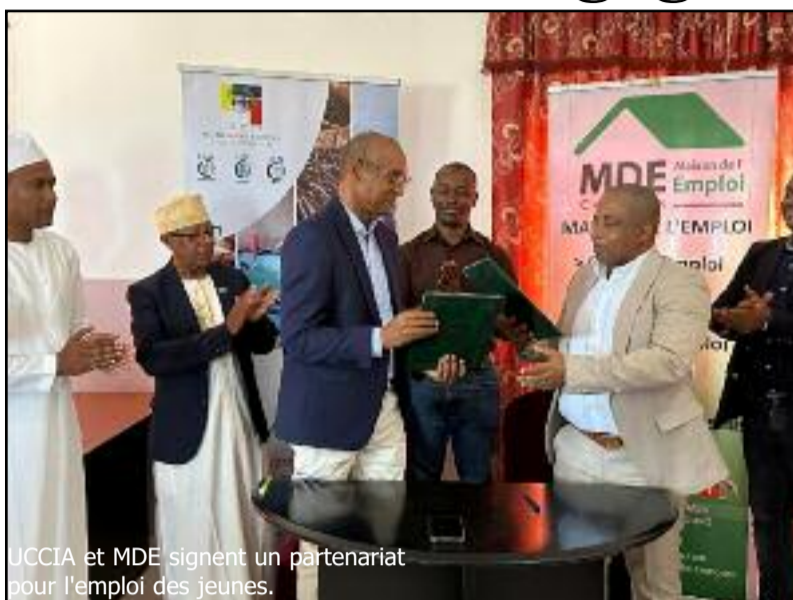
UCCIA et MDE signent un partenariat pour l'emploi des jeunes.

La Maison de l'emploi (MDE), est une institution paritaire gérée conjointement par l'Etat et les partenaires sociaux, organisations patronales et syndicats de travailleurs. Cela dit, la MDE a besoin de partenariat pour réaliser efficacement sa mission qui consiste à aider et orienter les jeunes à créer leurs entreprises. Et c'est dans cette optique que l'Union des chambres de commerce (Uccia) et la MDE ont signé ce samedi 22 octobre, une