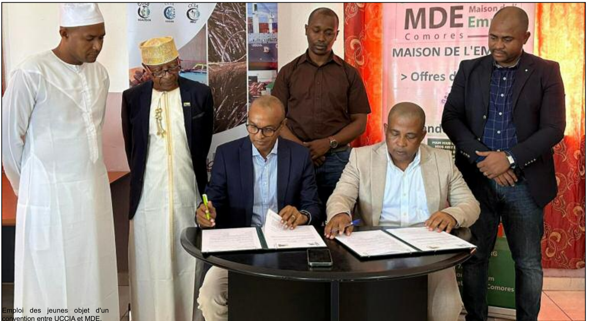
Emploi des jeunes objet d'une convention entre UCCIA et MDE.