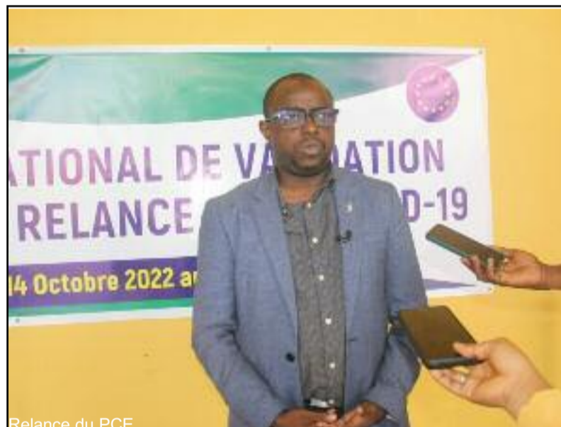
Relance du PCE

Selon lui, si le cap de l'émergence doit être maintenu, la stratégie pour l'atteindre devait être révisée au vu du nouveau contexte. « Au delà de la liste des projets prioritaires qui constituent le bras armé visible du PCE, vos travaux permettront j'en suis sûr d'identifier les principales réformes structurelles nécessaires à la bonne mise en œuvre du PCE. Je pense notamment au climat des affaires ou encore à la bonne