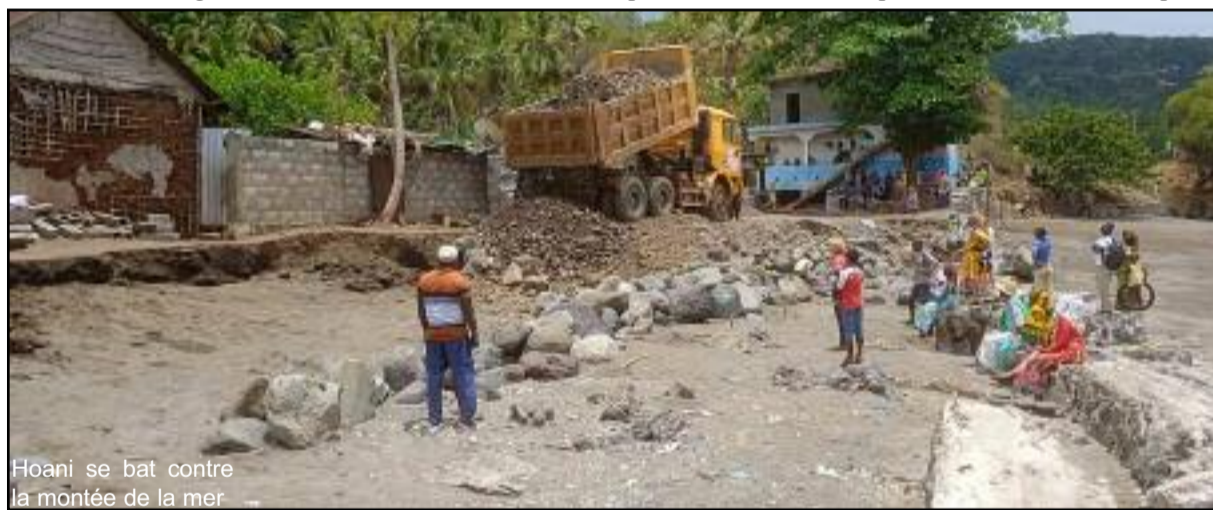
Hoani se bat contre la montée de la mer.