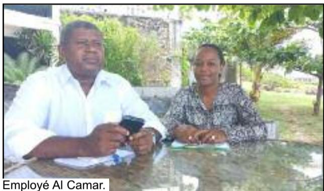
Employé Al Camar.