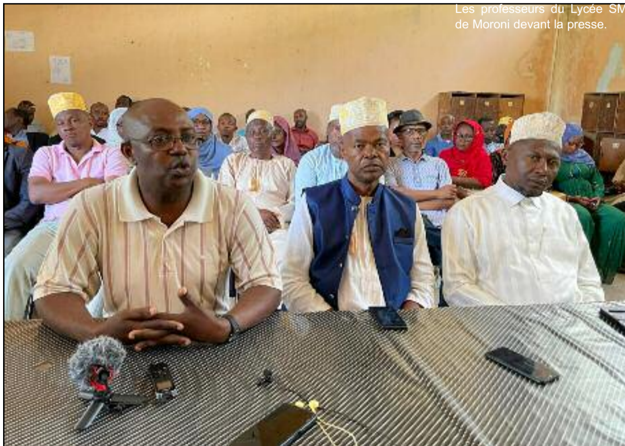
Les professeurs du Lycée SM de Moroni devant la presse.

« Nous appelons les gens qui ont accaparé des parcelles du lycée sans notre accord de quitter ces lieux avant la rentrée. Ces terrains appartiennent à l'Etat, nomment le lycée de Moroni. Ainsi, ils n'ont pas le droit d'y construire ni faire quoi que ça soit. Il y a des projets d'extension qui devront voir le jour bientôt, nous