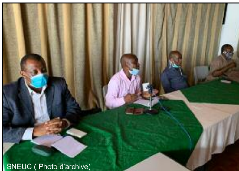
SNEUC ( Photo d'archive)

« Les procédures sont en cours et le projet de loi doit passer en interministériel bientôt, avant d'être présenté au conseil des ministres les semaines à venir. Après cette étape, le texte sera soumis aux parlementaires lors de la session d'octobre prochain pour adoption », affirme-t-il. Interrogé sur la sincérité du gouvernement quant à l'adoption de la nouvelle loi, le syndicaliste se dit confiant sur les engagements du gouvernement, mais tout de même avec une certaine réserve. « Si jamais le gouvernement trahit sa promesse, on a prévu de nous revoir le 15