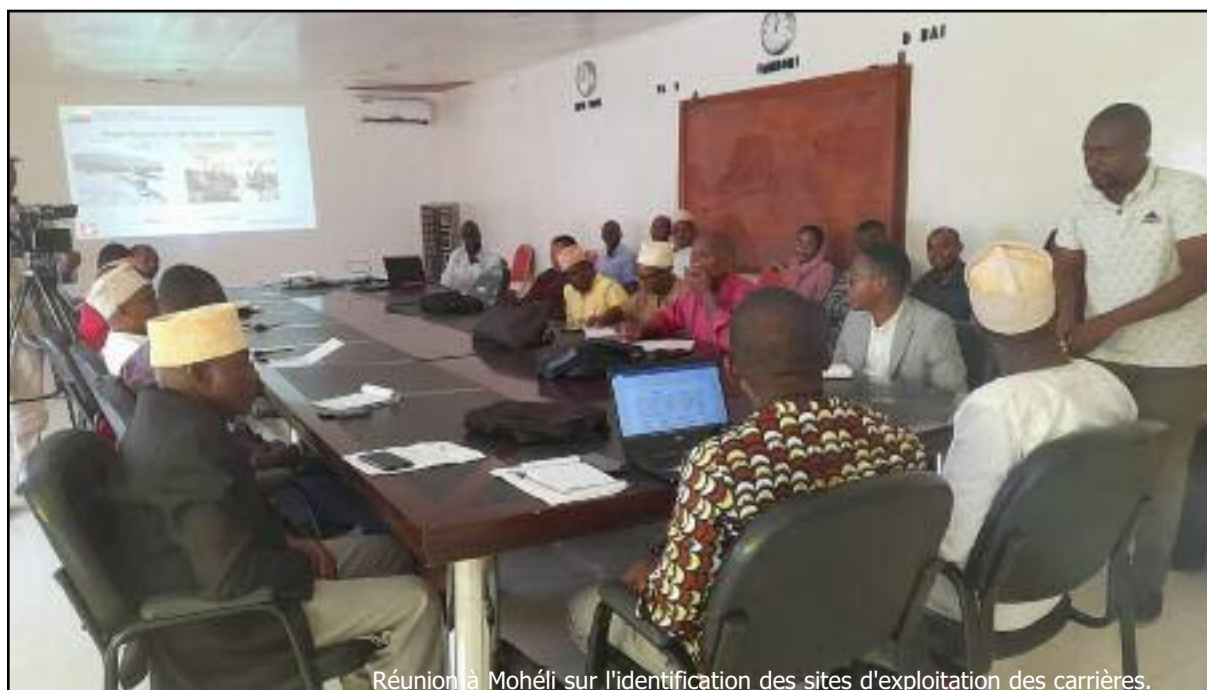
Réunion à Mohéli sur l'identification des sites d'exploitation des carrières.