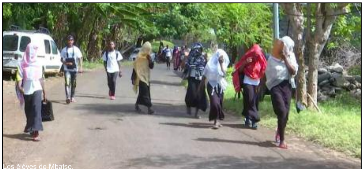
Les élèves de Mbatse.