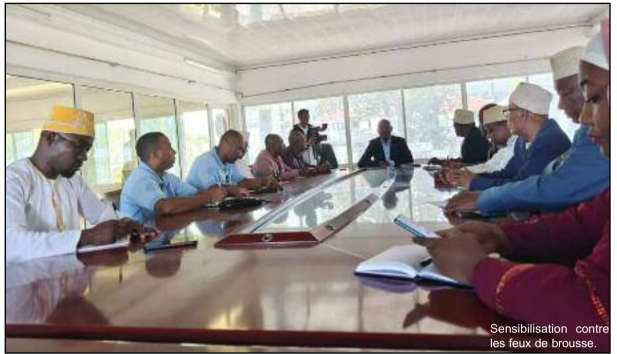
Sensibilisation contre les feux de brousse.

plusieurs facteurs déclencheurs de ces incendies. Certains d'entre eux, ont montré que c'est le fruit des pyromanes, le manque de pétroles, les gens cherchent à se procurer du bois, la sécheresse, etc. Ils ont donc recommandé qu'on sensibilise les résidents sur l'interdiction de certaines pratiques dans les zones à risque comme l'utilisation de matériaux pouvant s'enflammer rapidement,