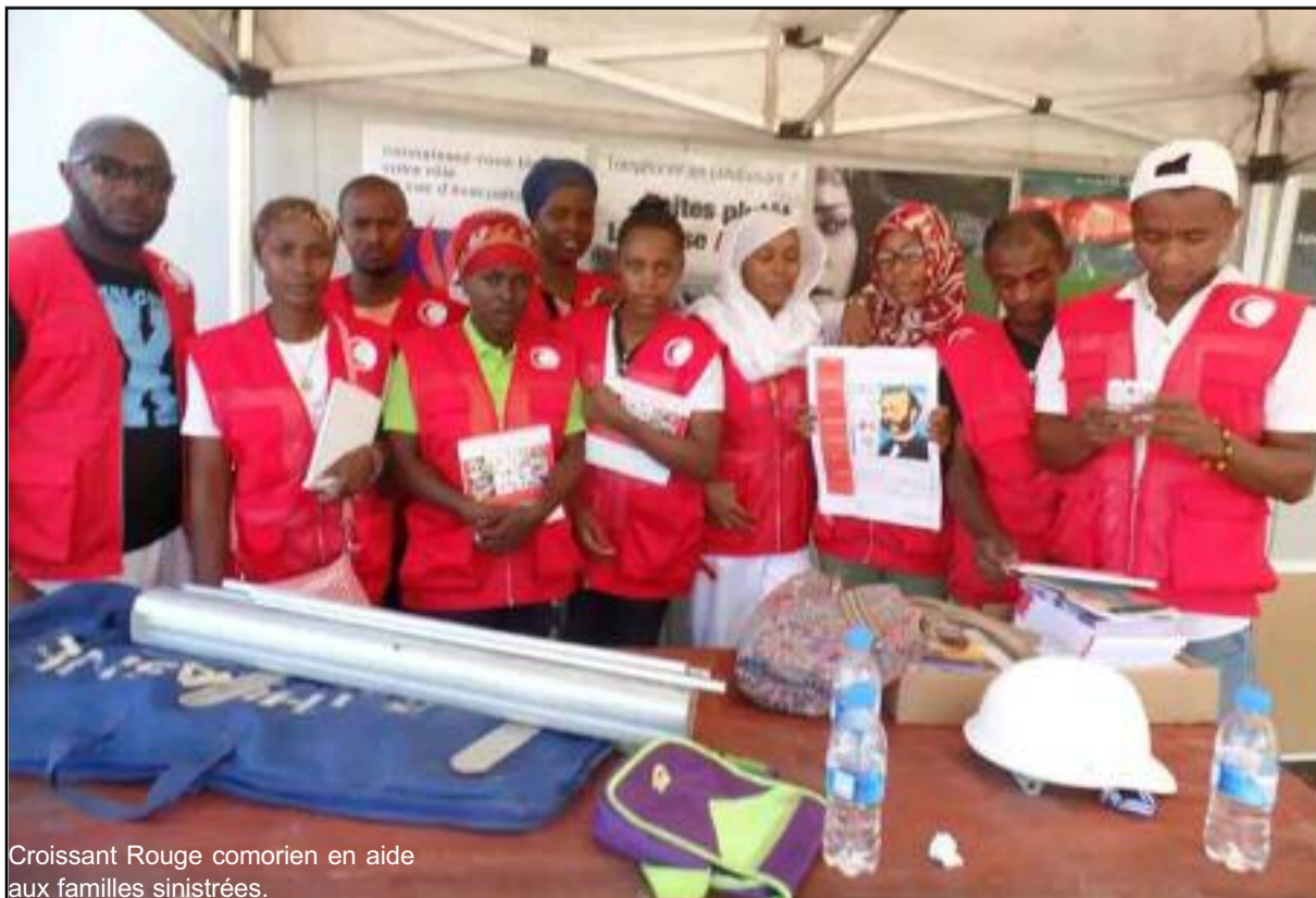
Croissant Rouge comorien en aide aux familles sinistrées.