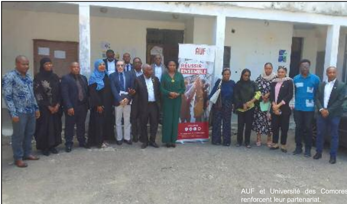
AUF et Université des Comores renforcent leur partenariat.