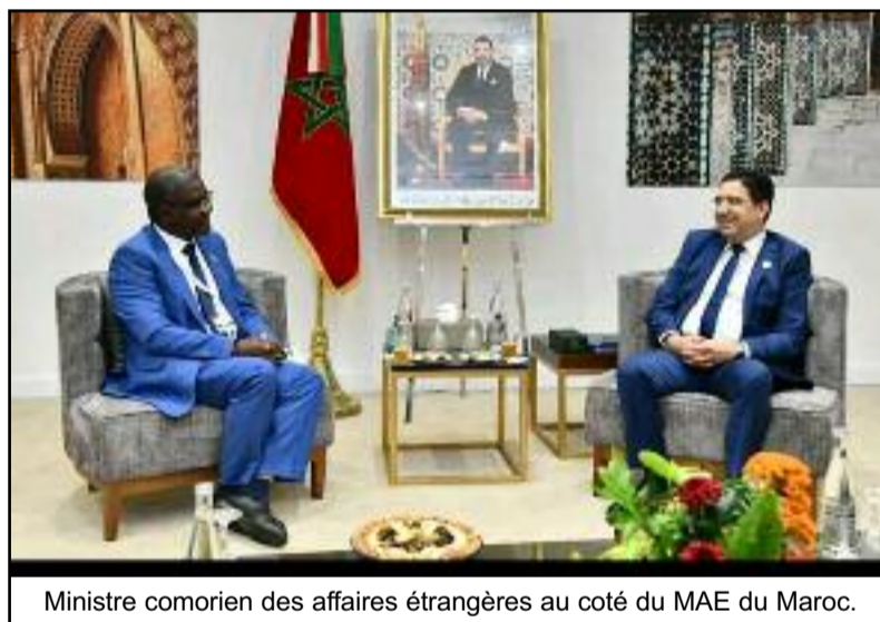
Ministre comorien des affaires étrangères au côté du MAE du Maroc.

réalisation du plan Comores Émergents (PCE). Ce sommet qui a commencé du 19 juillet dernier pour s'achever ce 22 juillet, a réuni une forte délégation gouvernementale américaine, des ministres, des demandeurs multinationaux américains et des acteurs africains du développement. Il s'agit d'une opportunité de consolider le positionnement stratégique du Maroc qui est le seul pays