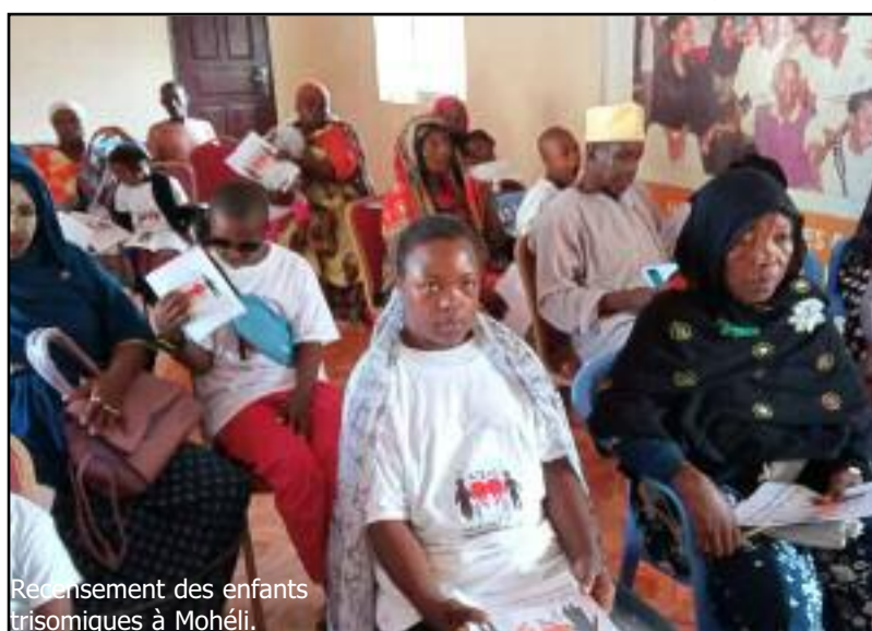
Recensement des enfants trisomiques à Mohéli.