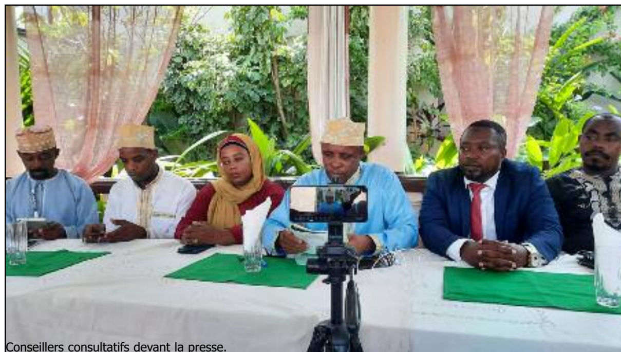
Conseillers consultatifs devant la presse.