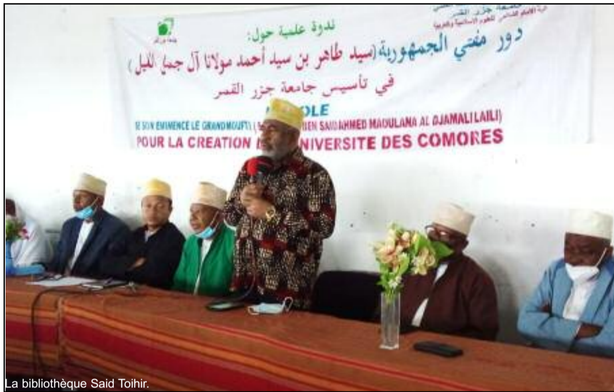
La bibliothèque Saïd Tohir.