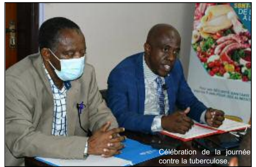
Célébration de la journée contre la tuberculose.