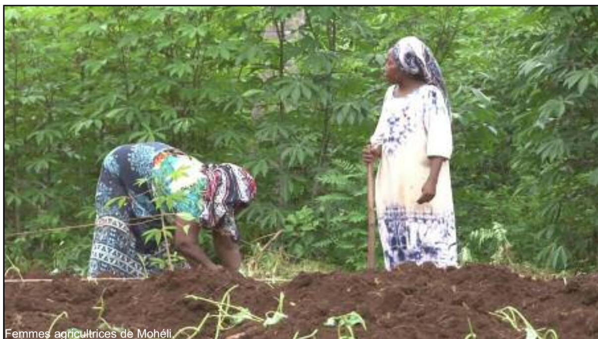
Femmes agricultrices de Mohéli.

A Mohéli les femmes cultivent la terre, elles sèment et assurent également en grande partie la commercialisation des produits agricoles dans l'île. Elles participent beaucoup plus à des activités agricoles par rapport aux hommes. Selon le projet PREFERE en 2019, environ 346 agricultrices ont été recensées dans l'île. Ce chiffre devait obligatoirement croître en 2020 et 2021 puisque le secteur agricole a pris un nouvel élan. Grâce aux aides gouvernementales ainsi qu'aux ONG internationales, beaucoup de femmes se regroupent en créant des coopératives ces deux dernières années afin d'intensifier les produits agricoles dans l'île. Certaines d'entre