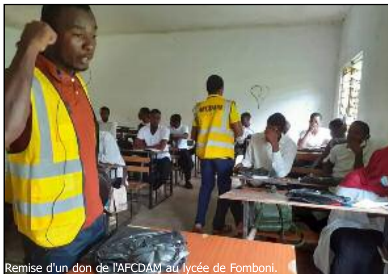
Remise d'un don de l'AFCDAM au lycée de Fomboni.