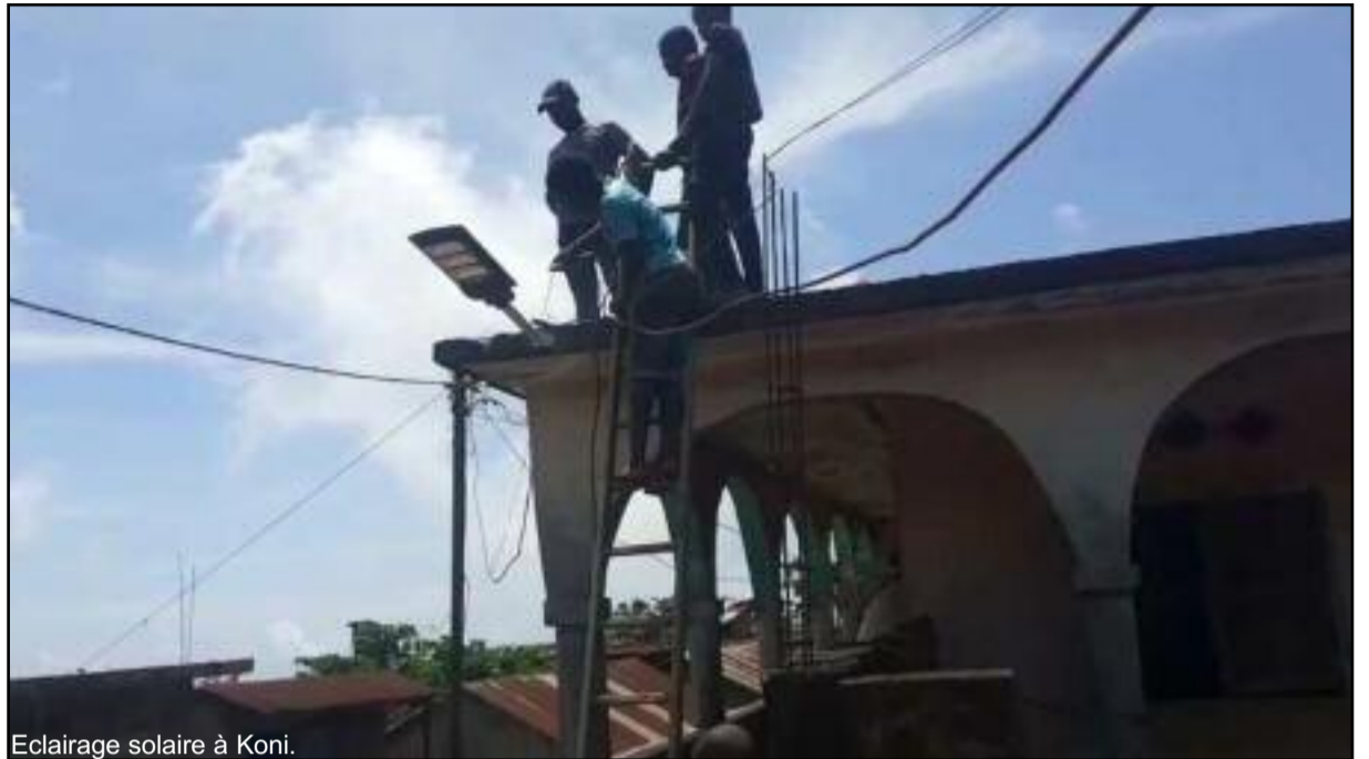
Eclairage solaire à Koni.

Quant aux femmes, les prières ne s'arrêteront jamais pour demander protection à leurs fils résidents de Mayotte. « Aujourd'hui, il y a une grande boutique cosmétique et des habits de luxe grâce au soutien de la diaspora », avance une femme de cette localité. De passage, des habitants rappellent au Président Azali qu'à sa dernière visite à Koni