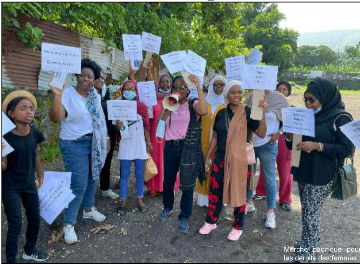
Marche pacifique pour les déroits des femmes.

« Femme, levez-vous pour vos droits », tel est le slogan de la marche du collectif Hima. Ces femmes militantes ont manifesté pour réclamer les droits de la femme. Selon elles, il est temps que la femme comorienne soit respectée et valorisée.