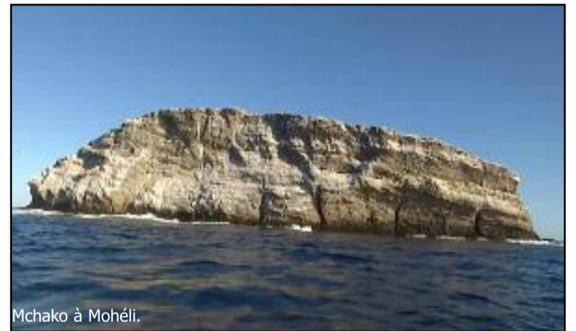
Mchako à Mohéli.

Les habitants d'Itsamia tirent bénéfice de cette pierre blanche. D'abord en tant que lieu touristique, mais aussi une réserve naturelle de pêche. « En 2020, deux pêcheurs d'Itsamia avaient fait leurs pêches dans ce lieu pendant un mois et ils ont gagné plus de 700 000 fc de bénéfice. « Pour venir pêcher autour de cette pierre,