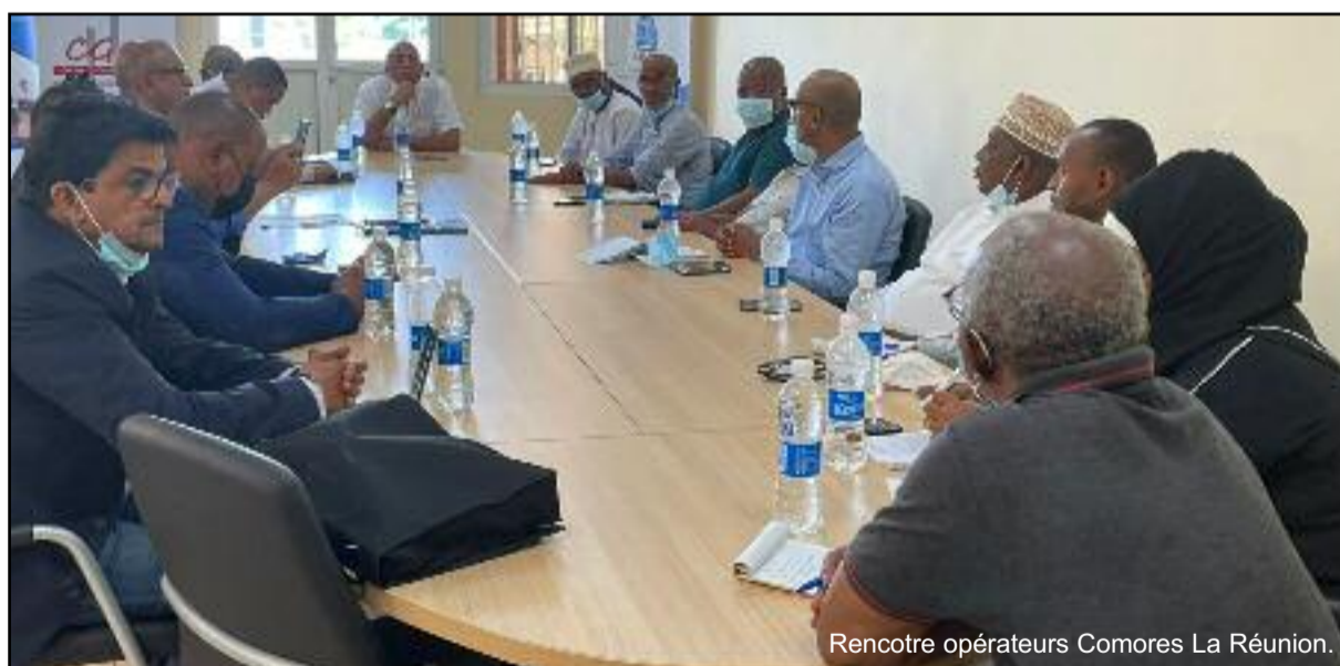
Rencontre opérateurs Comores La Réunion.

À travers leurs visites dans le pays, dans les différents restaurants et hôtels, ils ont remarqué le besoin criant en matière de formation sur ces domaines. « Nous en tant qu'institution nous nous souscrivons dans cette démarche. Dans la mesure où nous pensons qu'avec les hôtels qui seront construits les années à venir dans le pays, nous avons besoin de nous préparer pour la main d'œuvre. Ce qui est une bonne chose vu que notre jeunesse est frappée de plein fouet par le chômage et c'est une façon d'y remédier » souligne celui qui précise que la Chambre de commerce privilégie la formation conti-