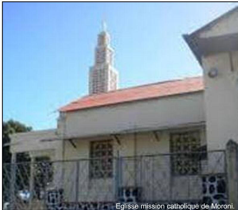
Eglise mission catholique de Moroni.