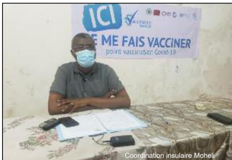
Coordination insulaire Mohéli

Cette 4ème cohorte bis n'est pas du tout facile car il leur a été demandé de vacciner en 3 jours le même nombre de personnes vaccinées en un mois pendant les deuxième et troisième cohortes. « Les équipes déployées sur le terrain ont du pain sur la planche mais je sais compter sur leur bonne foi, leur volonté et leur expertise, leur savoir et savoir-faire pour que ce challenge soit rele-