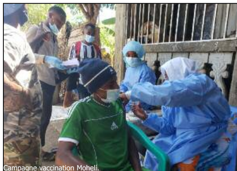
Campagne vaccination Moheli.