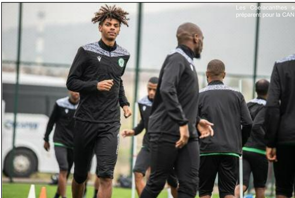
Les Cœlacanthes se préparent pour la CAN

Actuellement au 132e rang du classement FIFA, les Comores feront face le 31 décembre prochain à la Côte-d'Ivoire l'une des meilleures nations du continent (champion d'Afrique en 1992,