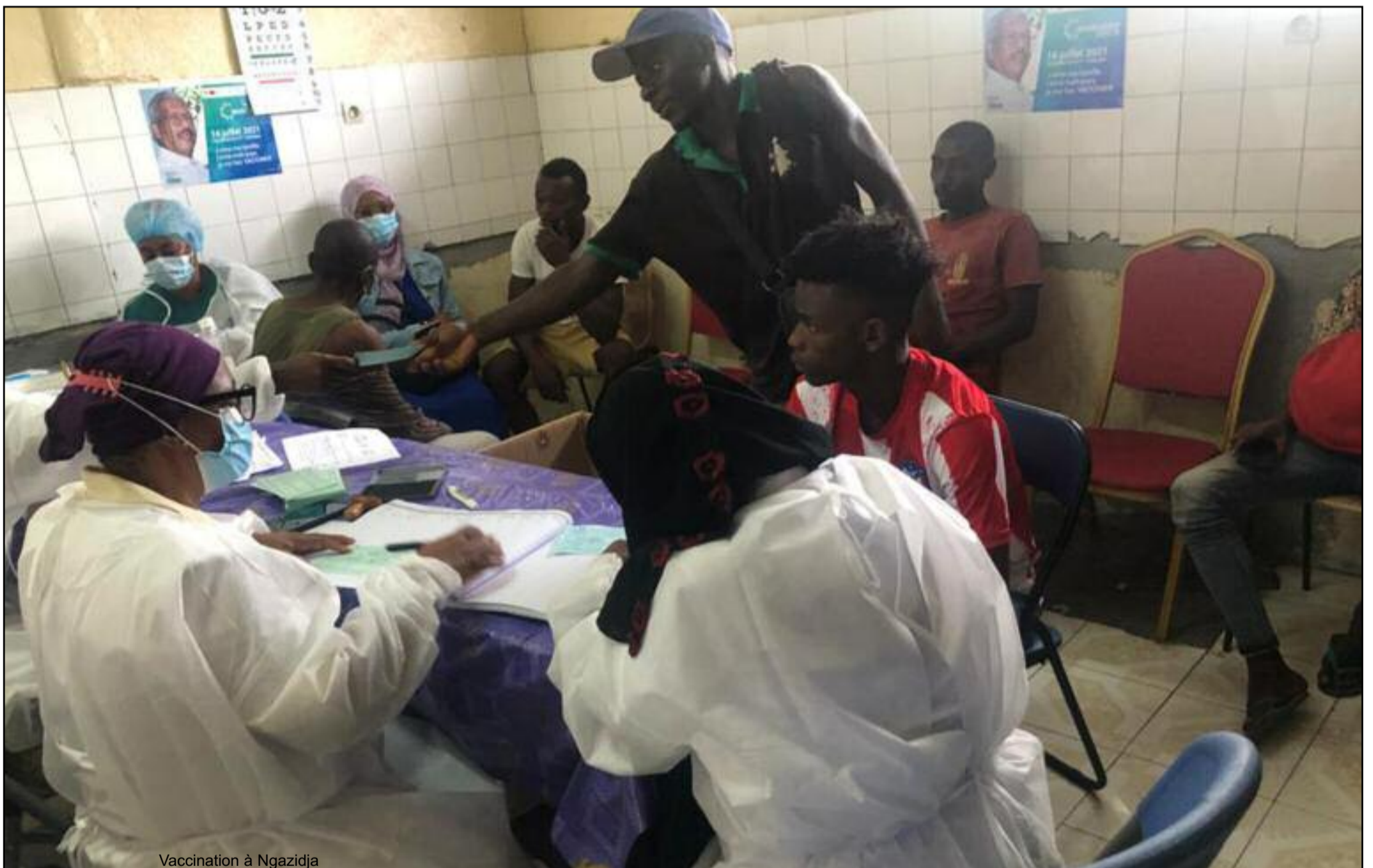
Vaccination à Ngazidja