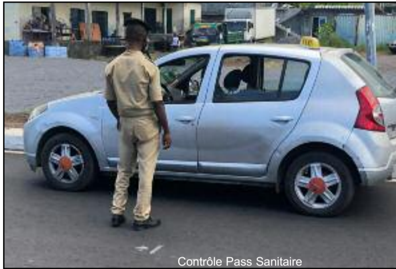
Contrôle Pass Sanitaire

« La gendarmerie doit sanctionner le passager s'il n'a pas son pass sanitaire et non le chauffeur. Sauf si le taximan n'a pas son carnet de vaccination », explique-t-il. « La majorité des chauffeurs sont vaccinés. On ne cesse pas de les sensibiliser sur la vaccination. Donc, on ne peut pas les sanctionner parce qu'ils ont transporté des clients non vaccinés.