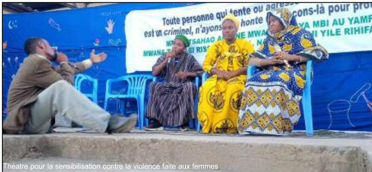
Théâtre pour la sensibilisation contre la violence faite aux femmes

Une caravane de sensibilisation a débuté dans la localité de Ntakoudja à Mohéli sous forme de pièce théâtrale. Elle a mobilisé toute la communauté locale, hommes et femmes toutes catégories d'âge confondues. L'idée c'est de mettre en scène un scénario inspiré des agressions sexuelles de plus en plus fréquentes dans la société et dont la majorité finit par des arrangements familiaux. Dans cette caravane de sensibilisation organisée par l'APPEF, l'auteur de la mise en scène relate l'histoire d'une jeune fille de 4 ans violée par un homme riche et très influent, pendant qu'elle rentrait de l'école coranique.