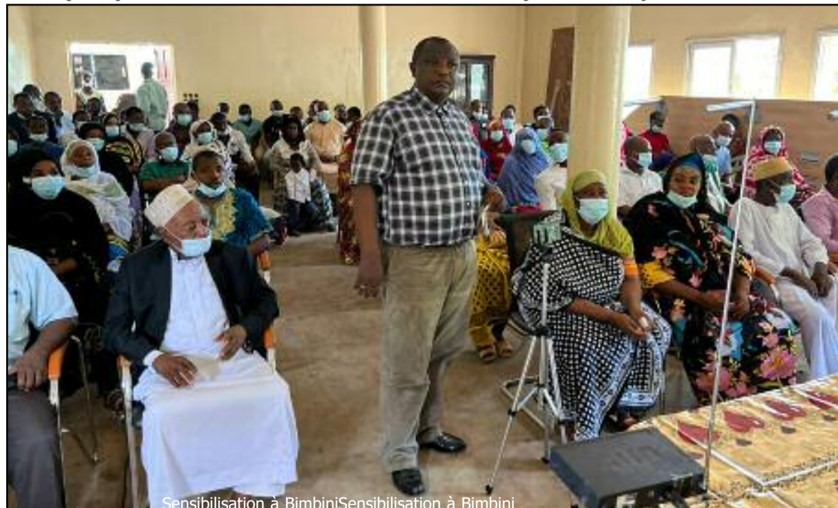
Sensibilisation à Bimbini