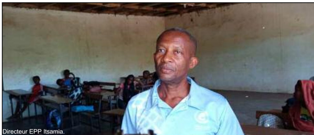
Directeur EPP Itsamia.