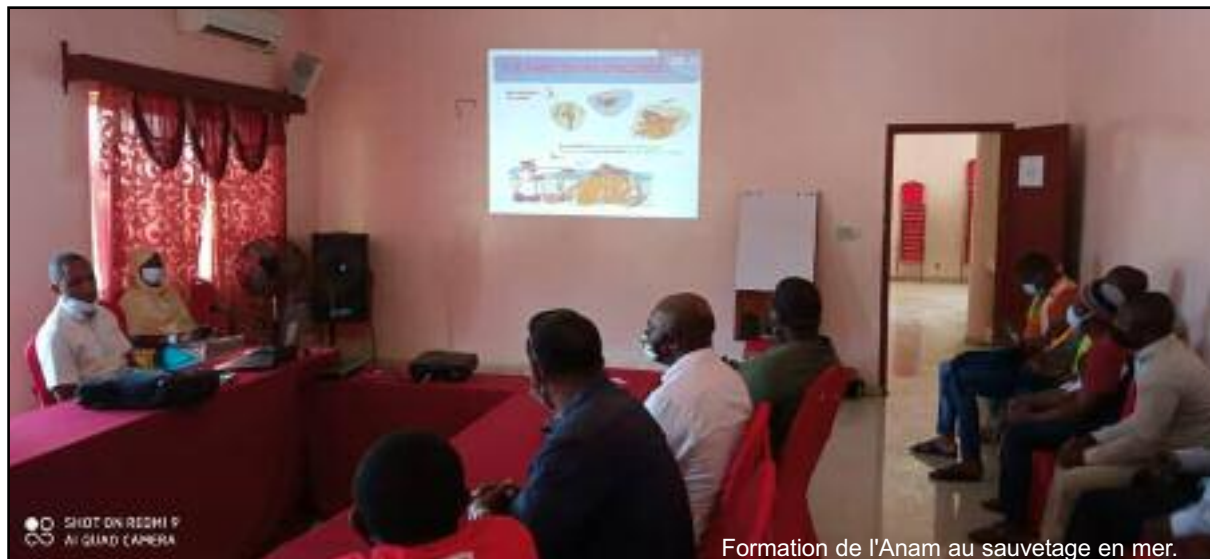
Formation de l'Anam au sauvetage en mer.