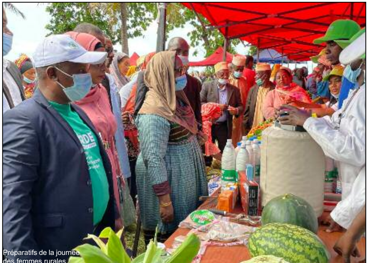
Préparatifs de la journée des femmes rurales.

Elles ont également dit prendre en considération certaines problématiques comme les enfants non scolarisés, l'échec scolaire et la délinquance