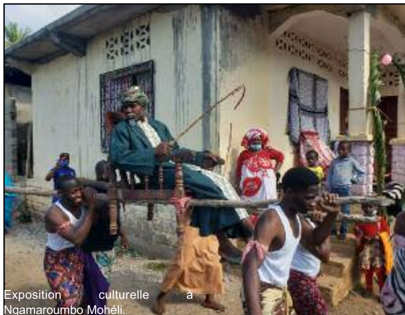
Exposition culturelle à Ngamarumbo Mohéli.