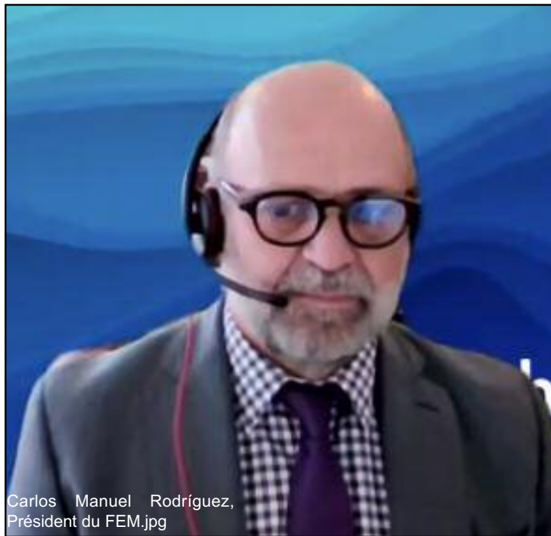
Carlos Manuel Rodriguez, Président du FEM.jpg

Les dix derniers lauréats, annoncés lors du sommet sur le climat COP26 à Glasgow, seront éligibles à des subventions comprises entre 440 000 et 1,3 million de dollars chacun, une fois entiè-