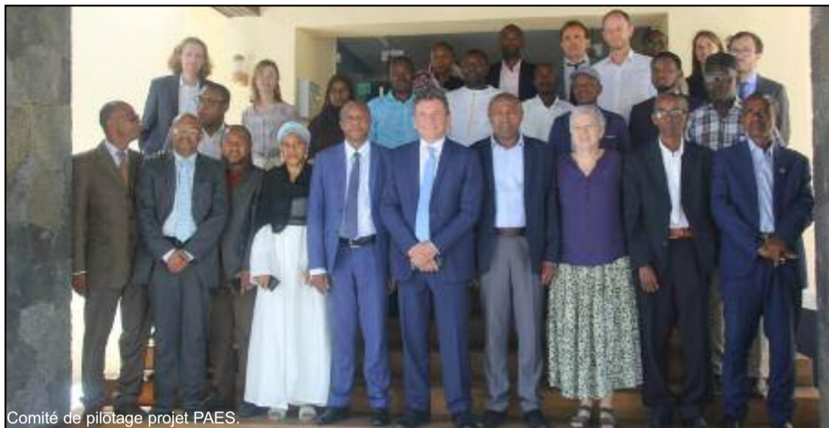
Comité de pilotage projet PAES.