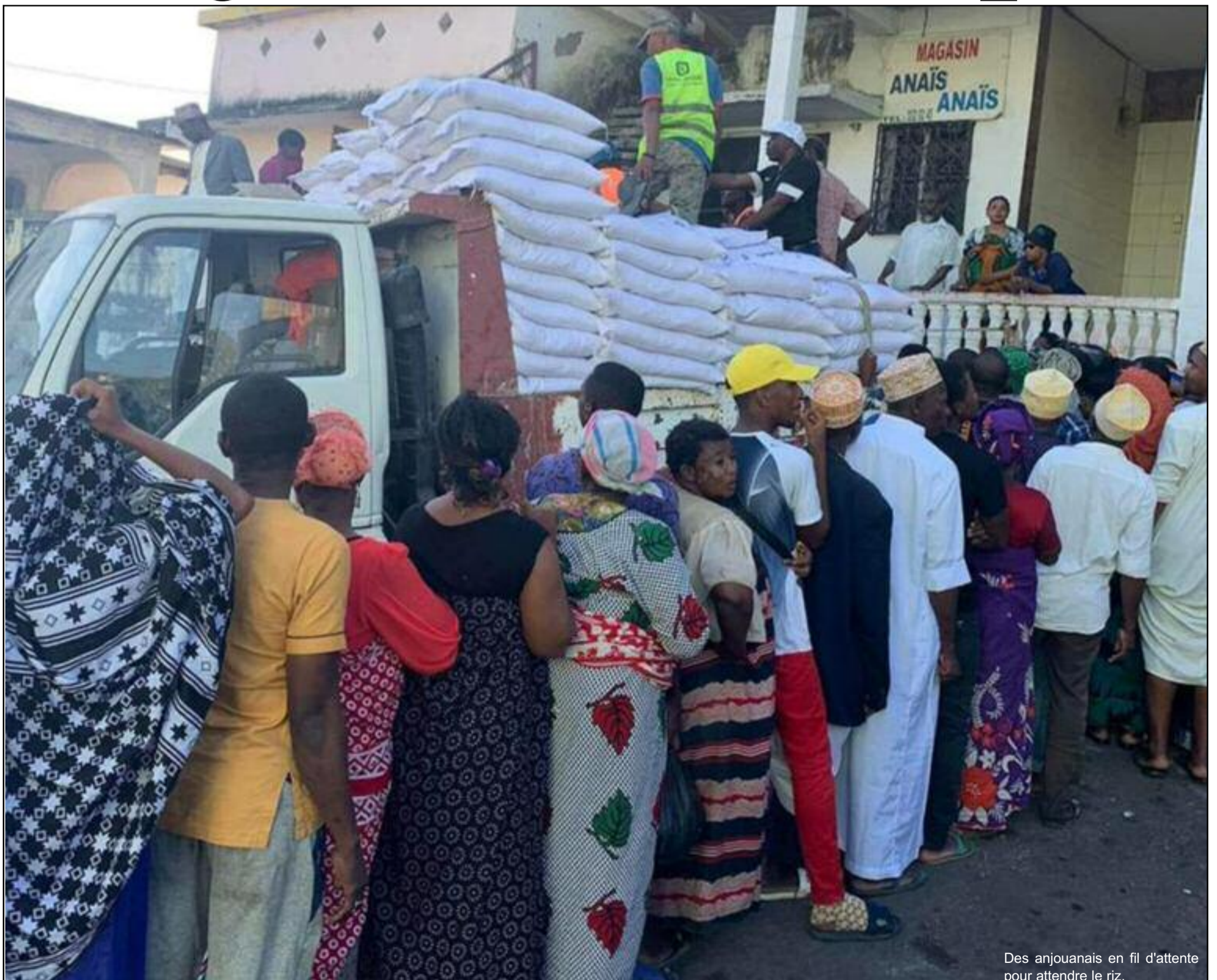
Des anjouanais en fil d'attente pour attendre le riz.