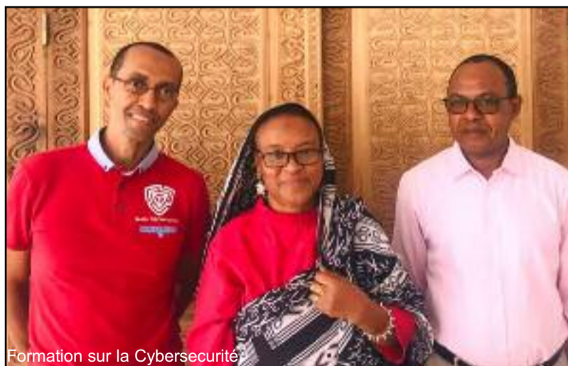
Formation sur la Cybersecurité