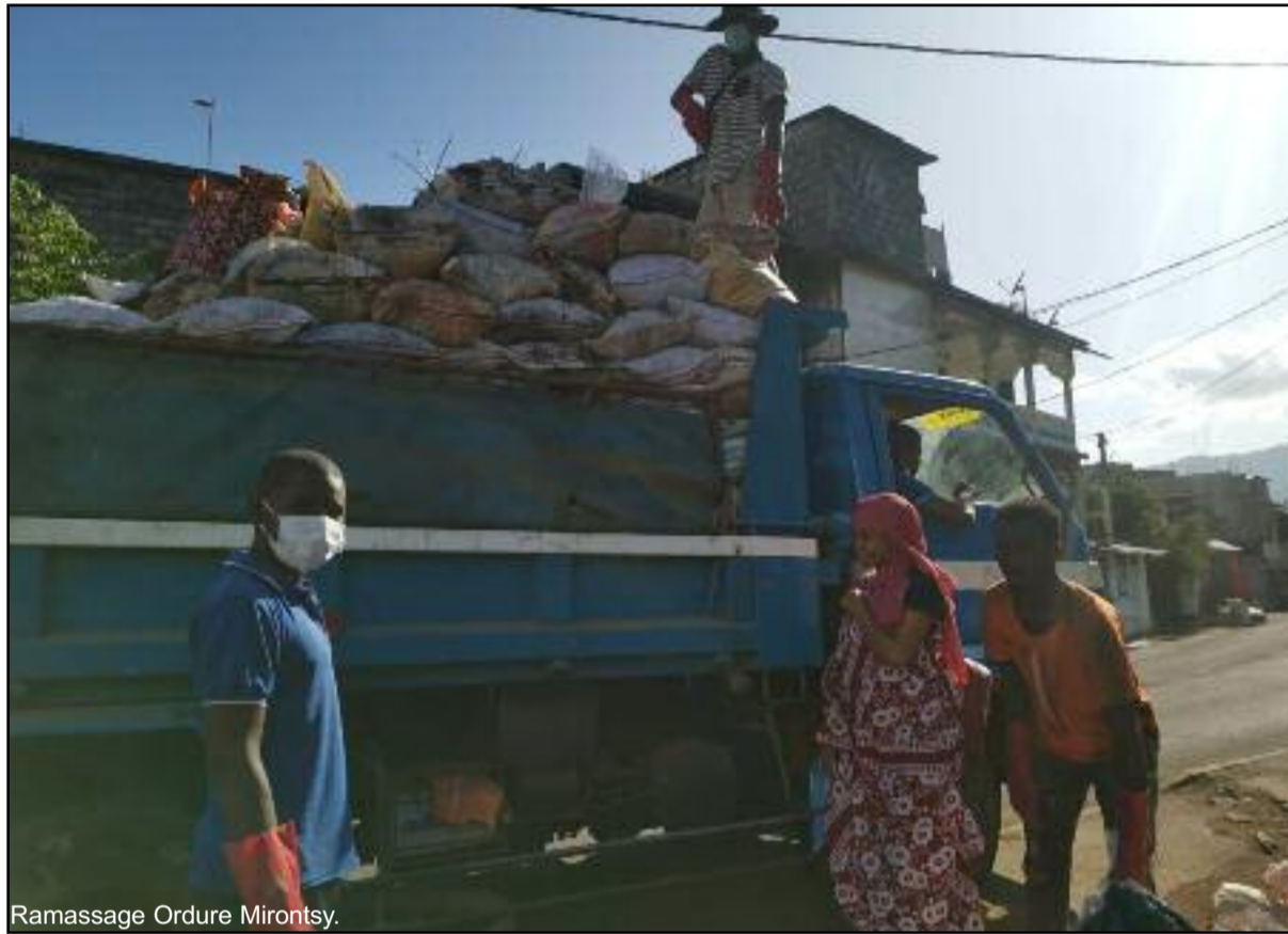
Ramassage Ordure Mirontsy.

Des habitants soutiennent quand-même ces jeunes qui œuvrent depuis longtemps avant d'acquérir ce camion sur plusieurs fronts pour l'intérêt de la commune. « Voija-Voija est une