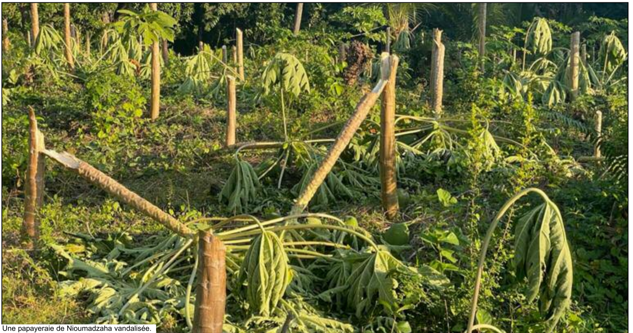
Une papayeraie de Nioumadzaha vandalisée.