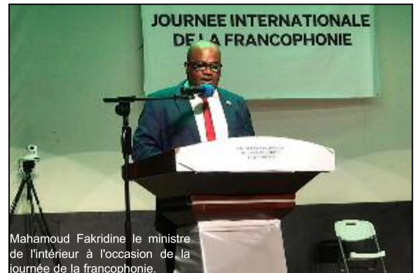
Mahamoud Fakridine le ministre de l'intérieur à l'occasion de la journée de la francophonie.

Et d'ajouter : « En ce qui concerne les jeunes, la priorité devra être accordée à leurs accès à une éducation et une formation de qualité, ainsi qu'à des occasions d'intégration socioprofessionnelles, pour leur assurer un avenir meilleur et l'épanouissement intellectuel qu'ils méritent. Les jeunes francophones doivent davantage s'approprier cette