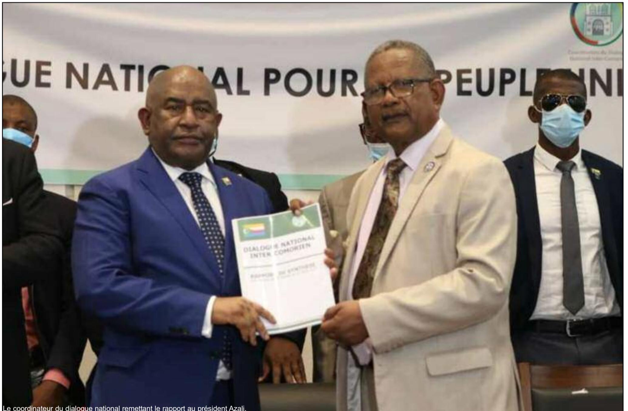
Le coordinateur du dialogue national remettant le rapport au président Azali.

Après trois semaines de concertations et de débats sur diverses thématiques relatives à la vie politique, institutionnelle et socioéconomique du pays, le Dialogue inter-comoriens a pris fin hier mardi. Devant les membres du gouvernement et le corps diplomatique, le chef de l'Etat a pris l'engage-